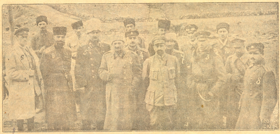
საქართველოს სამხედრო მინისტრი დარიალის ხეობაში