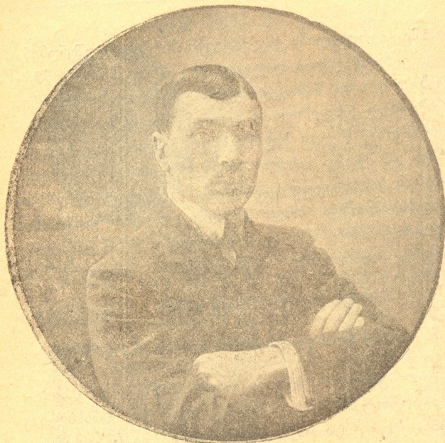
ი. გ რ ი შ ა შ ვ ი ლ ი