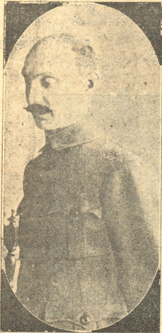
ვლ. ვ. ვ. გომბოზი (1878 — 1918)

აღსრულდა ნატკრა დიდხნის, გული ნეტარობს ღმერთთან; მწარედ ვიგონებ მწარ წარსულს, გულის ტკენით და წყენითა, ჩაგვრა, წამება სხვისაგან, უჩვევი წყულო, იარა, ვინ მოსთვლია ჩემმა სამშობლომ რა ტანჯვა გამოიარა! მაგრამ ეხლა კი წყვილია, უნს მიაქვს კრულოვა წყვილითა, და ჩემს სამშობლოს გულს იკრავს, ნათელ ხე მქათა ფენითა, გულში ნაგუბა დიდი ხნის, ბოლზა, ნაღველი ჰქრებიან, და ჩემიანი აღდგომას სიღერით ეგებებიან!.. იხარე, ჩემო ივერო, რომ აღადგინე უკლება, დღეიდან ჩემო საუნჯევე სხვა არვინ დაგეფულება; და ჰა, აღსრულდა დიდი ხნის, ნატკრა, ნანატრი გულითა, და მას მეც, ერის მგოსანი, უგალობს იხარულითა!