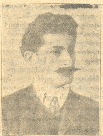
მიხეილ წერეთელი ცნობილი მწერალი და პოლიტიკური მოღვაწე.