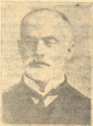
პეტრე სუგრულაძე ცნობილი მწერალი და პოლიტიკური მოღვაწე