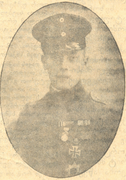
ვრაფი შულენბურგი გერმანიის ელჩი საქართველოს რესპუბლიკის წინაშე თბილისში