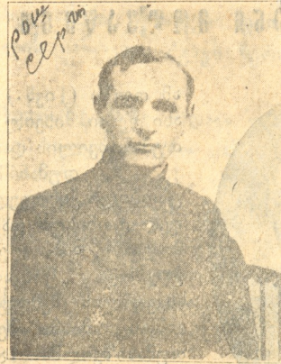
სერგო მ. უროშვილი ეროვნულ საბჭოს ქვესტორი

იურისტია, პორუჩიკი ახალგაზრდობიდანვე მონაწილე- ობდა ს.—დ. პარტიაში თავი ისახელა ილ ქავეჭავაძის გარდაცვალების დროს თანამშრომლობდა ლ. დარჩია- შვილის, ჩვენ კვალში და სხ. ჟურნალ გაზეთში. და ძველი მთავრობისგან იღვენებდა რევოლიუციის დიდი მაგი დასდო. იყო წევრად პეტროგრადის მუშათა და ჯარისკაცთა საბჭოს წევრად და ოზურგეთიდან თათრე- ბის გარეკვაშიაც მონაწილეობდა. ამიერ კავკასიის სე- იმში იგი ქვესტორად აირჩიეს, რომელ თანამდებობასაც უკვე საქართველოს ეროვნულ საბჭოში ასრულებს და თვისი მუყაითი მუშაობით ჩვენს ეროვ. საბჭოს გარეგნუ- ლად წესის დაცვით დასავლეთ ევროპიის პარლამენტს უახლოვებს.