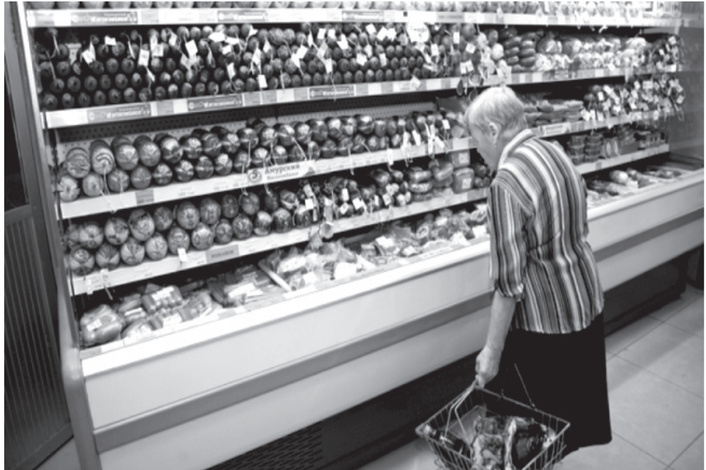
ველობა, დოკუმენტური შემოწმება, ნიმუშის აღება. დოკუმენტური შემოწმება, რომელიც ითვალისწინებს ბიზნესოპერატორის

სურსათის უვნებლობის სახელმწიფო კონტროლის მიზანი, რომელსაც სურსათის ეროვნული სააგენტო ახორციელებს, სურსათის უვნებლობის სფეროში არსებული კანონმდებლობის მოთხოვნების შესაბამისობის დადგენაა, რასაც ვახორციელებთ შემდეგი მექანიზმებით: ინსპექტირება, მონიტორინგი, ზედამხედ-