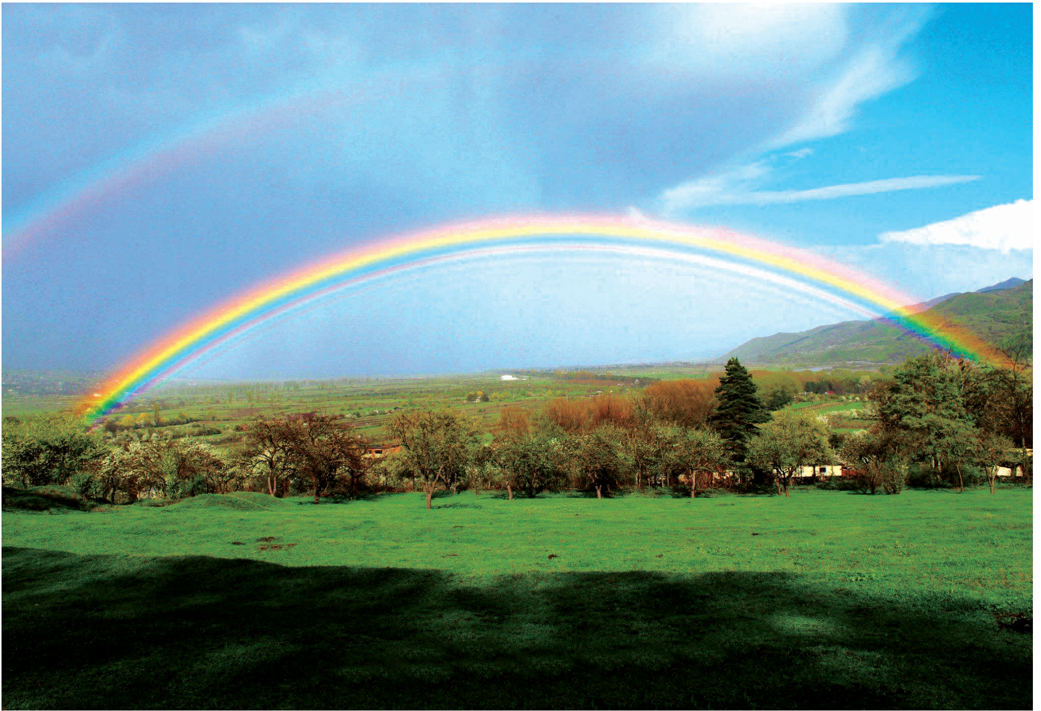
ქვიშეთის სანახებიდან, მოჩანს ხაშურის ველები და როგორც შარავანდედი, თავს ადგას ცისარტყელები.