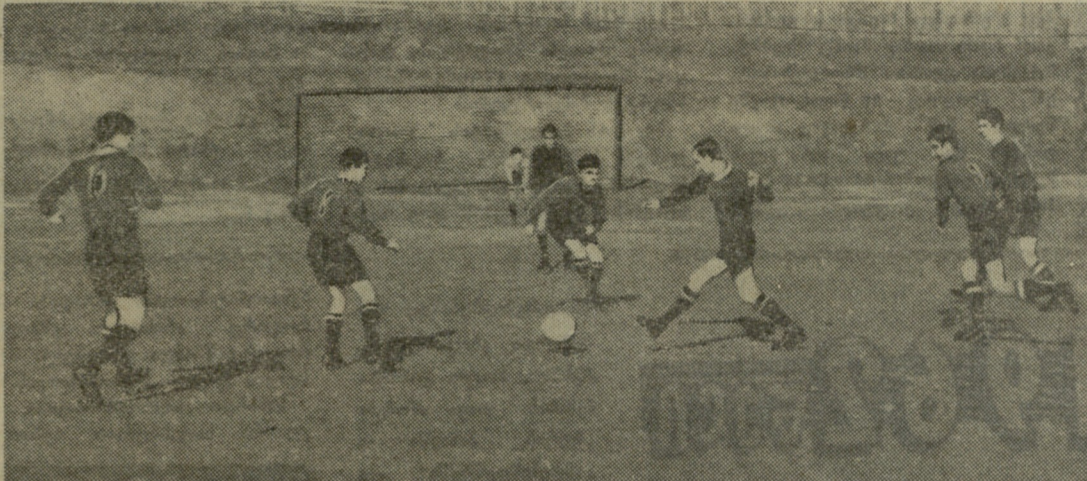
გუმათის სკოლა-ინტერნატის ფიზკულტურულ კოლექტივში მრავალი სექცია მუშაობს. მათგან გამოირჩევა ფეხბურთის სექცია, რომელიც ხშირად აწყობს ამხანაგურ მატჩებს მეზობელ სკოლებთან.