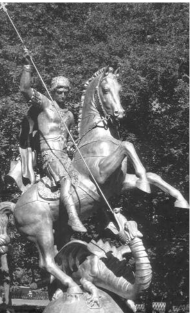
ვა. გიორგი (მოსკოვი)

ლიმისა და მცხეთის სვეტიცხოველს შორის არსებობს წერეთლის თანმდევი... მცხეთის შემოსასვლელში, თბილისში აღმართული „წმინდა ნინოს“ ხატება საქართველოს თანმდევი გახდა.