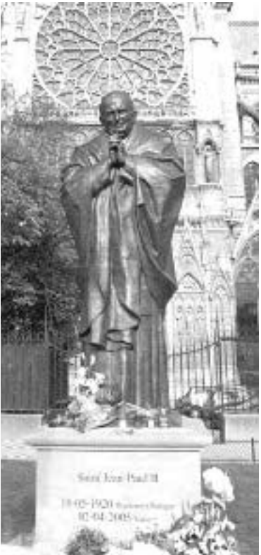
რომის პაპი იოანე პავლე II

ნია მოახმარა იმას, რათა ეს ორი მოვლენა ერთმანეთთან შეეერთებინა – ქართველი ხალხი და ქრისტიანობა – ლიტურგიულ წესრიგში დააუნჯა. ეს უდიდესი მისიაა, რომელიც გულისხმობს არა მარტო უსახლდრო განსწავლულობას, არა მარტო ქრისტიანული კულტურის ღრმა ცოდნას, არა მარტო ქართული გონის სიყვარულს, არამედ ლიტურგიკის აზრობრივ-სპირიტუალური ფესვების წვდომასაც. არა მხოლოდ მეცნიერულ-ანალიტიკურ გონს, არამედ ღვთისმოსაობის საკრალურობის უტყუარ შეგრძობას, რელიგიურ შთაგონებას და ჭეშმარიტ პოეტურ ტალანტს. ვინ არის კიდევ წერეთლის გარდა სხვა, რომლის ქმნილებებმაც უნდა ასაზრდოოს და ამოძრავოს ქართველი? ვის უყვარს კიდევ სამშობლო ასეთი ძალით?