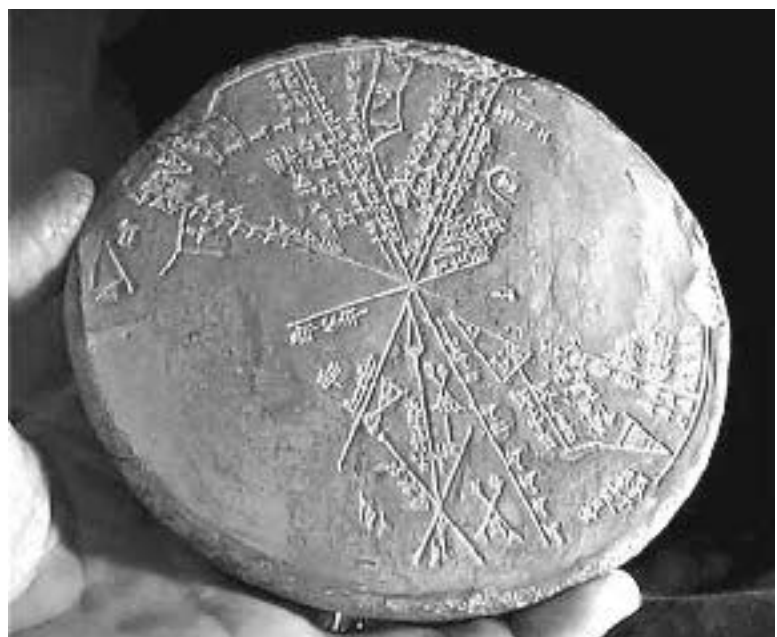
შუამრთა მზის სისტემის რუკა