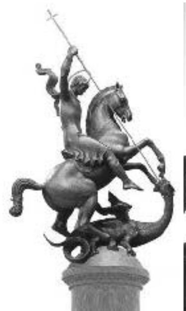
ვა. გიორგი (თბილისი)