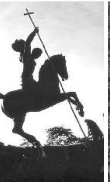
ვა. გიორგი (ნიუ იორკი)