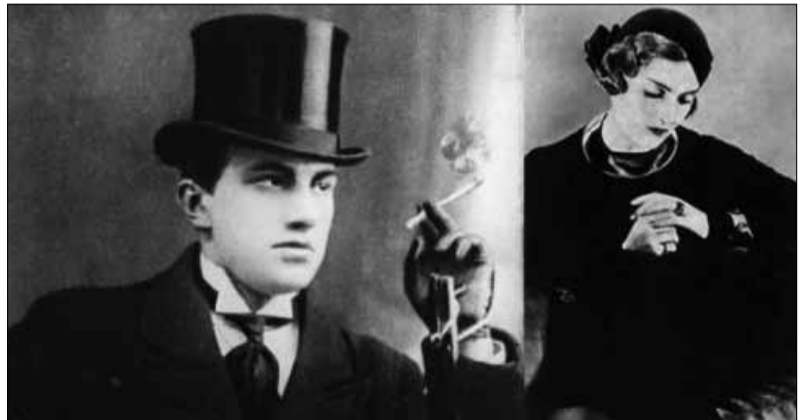
ვლადიმერ მაიაკოვსკი და ტატინა იაკოვლევა

და ამ დროს კარზე ზარი გაისმა... საბჭოთა ინჟინერს ცხოვრებაში მანამდე არასოდეს ენახა ასეთი ძვირფასი თავიგული, რომლის უკან თითქმის არ ჩანდა კურიერი, თავიგული ოქროსფერი იაპონური ქროზანთემებისა, რომლებიც მზის სხივებს ჰგავდა. და მზეზე მბრწყინავი ამ სილამაზის მიღმა კურიერის ხმამ წარმოთქვა: "მაიაკოვსკისგან".