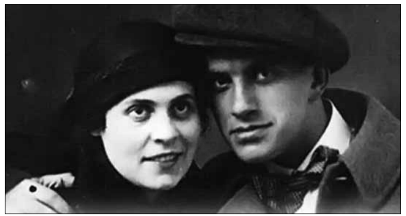
ლილია ბრიკი და ვლადიმერ მაიაკოვსკი

პარიზში მოღვაწეობისას მიღებული მთელი ჰონორარი მაიაკოვსკიმ ვაღარიცხა ცნობილი ყვავილების მაღაზიის ანგარიშზე ერთადერთი მითითებით: კვირაში რამდენჯერმე უნდა მიეტანათ ტატინა იაკოვლევასათვის თავიგული, რომელიც შედგებოდა ყველაზე უჩვეულო და ლამაზი ყვავილებისგან - ჰორტენზიების, პარმის იების, შავი ტიტების, ჩის ვარდების, ორქიდების, ასტრებისა ან ქროზანთემებისგან. პარიზული ფირმა, რომელსაც საკმაოდ კარგი რეპუტაცია ჰქონდა, ზედმიწევნით ასრულებდა შემოკლილი კლიენტის ამ უცნაურ თხოვნას - და მას შემდეგ, მიუხედავად ამინდისა თუ წელიწადის დროისა, კვირაში რამდენჯერმე ტატინა იაკოვლევას სახლის კარზე ისმოდა კაკუნის, კურიერს შეჰქონდა ულამაზესი თავიგული და ამბობდა: "მაიაკოვსკისგან". 1930 წელს პოეტი გარდაიცვალა - ამ ამბავმა ქალს თავზარი დაცია... ის უკვე მიეჩნეოდა იმას, რომ შემოკლილი პოეტი გამუდმებით იჭრებოდა მის ცხოვრებაში; შეეჩნეა იმ აზრს, რომ სადღაც იქ მასზე შეყვარებული მამაკაცი და ყვავილებს უგზავნიდა. დიახ, ისინი ერთმანეთს საერთოდ არ ხვდებოდნენ, მაგრამ ის ფაქტი, რომ არსებობდა ადამიანი, რომელსაც ასე ძალიან უყვარდა, გავლენას ახდენდა ყველაფერზე, რაც ქალის ცხოვრებაში ხდებოდა: ისევე, როგორც მთავრე ახდენს გავლენას ყველაფერზე, რაც დედამიწაზე არსებობს, მხოლოდ იმიტომ, რომ გამუდმებით ტრიალებს მის ახლოს.