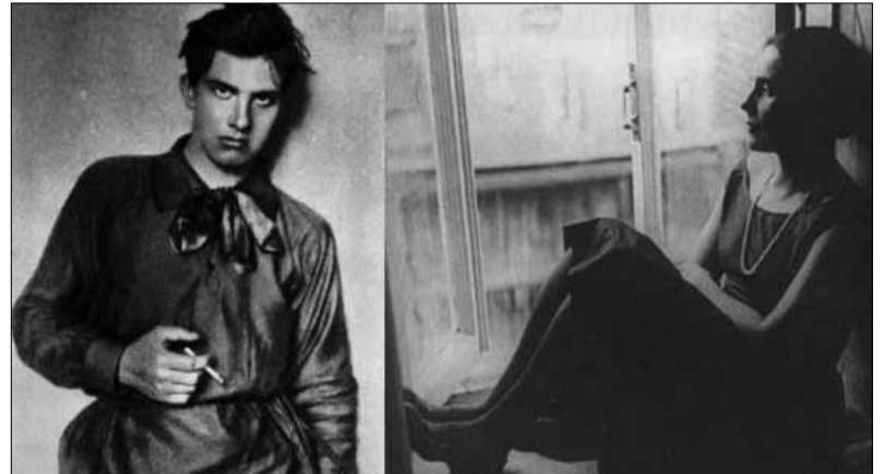
ლილია ბრიკი და ვლადიმერ მაიაკოვსკი

ტატინამ უკვე აღარ იცოდა როგორ გაეგრძელებინა ცხოვრება - ცხოვრება ამ გიჟური, ყავილებში ჩაფლული სიყვარულის გარეშე. მაგრამ მითითებაში, რომელიც პოეტმა პარიზულ საყვარელს დაუტოვა, მის სიკვდილზე არაფერი იყო ნათქვამი. ამიტომ, პოეტის გარდაცვალების მეორე დღეს ქალის სახლის ზღურბლზე ისევ გამოჩნდა კურიერი ულამაზესი თავიგულით ხელში და ისევ გაისმა უცვლელი სიტყვა: "მაიაკოვსკისგან".