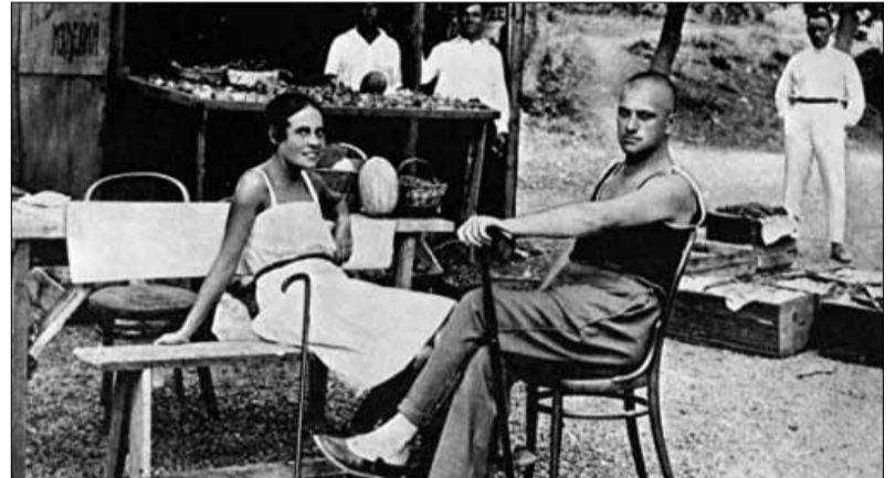
ლილია ბრიკი და ვლადიმერ მაიაკოვსკი