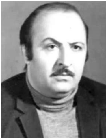
ნათქვამია, კაცი მოკვდა, ჯერ თავს მოუკვდა, მერე - ცოლსა და შვილსაო.

მაგრამ - არიან, ვინც ერსა და მამულსაც მოუკვდნენ. მადლობა ღმერთს, ასეთი ღვანღმოსილნი კარგა გვყოლია ქართველებს. სხვა ამბავია, რამდენად ვუსმინეთ მათს შეგონებას და დავაფასეთ მათი გონი და შემართება.