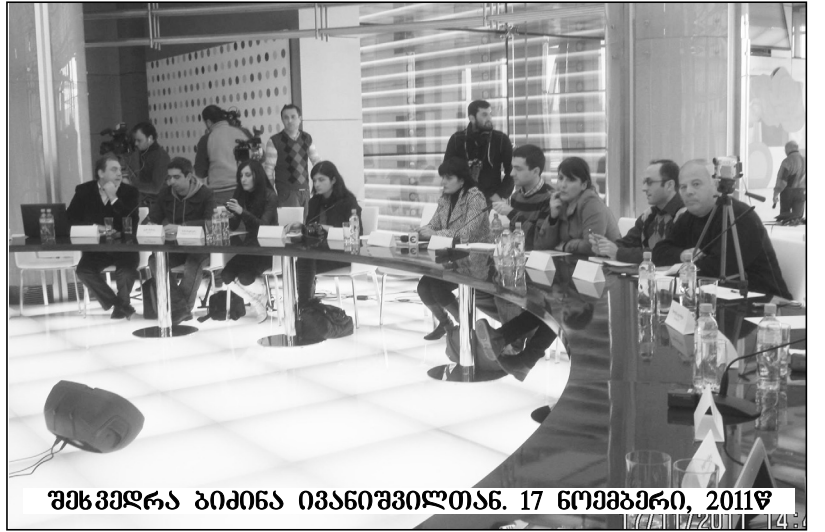
შხვამდრა ბიპინა ივანიშვილითან. 17 ნოემბერი, 2011წ