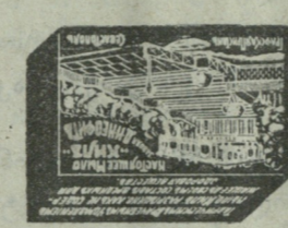
მოითხოვეთ შეუღარებელი ტალღების საპონი დ. ნ. ნეოფიტისის სევისტოპოლიში

ღია ყოველდღე მისიარულე ავთომეფთათვის, ვოგზდის ქ. № 8; ნ. ფინიჯიანისა (ტელეფონი 695). მ. ბ. მანავლიტი კბილის ავთომეფ. ყოველ დღე 10—11 ს. მ. ი. გომარტილი ყოველ დღე 2—3 ს.; შინაგან და ბავშვ. ავთომეფ. მ. ბ. გ. დინასიმი : ყოველ დღე 11 1 / 2 —12 1 / 2 ს.; სიფილ., ვენ. და კანის ავთომეფ. მ. გ. მ. მალაზიმი : ყოველ დღე; 1—2 ს.; დედათა და ქურთუგ. ავთომეფ. მ. ბ. ბ. პოპოვი : ყოველ დღე, გარდა კვირისა 12—1 ს.; ყვლის, ცხვირის და ყურის ავთომეფ. ფსეხები რჩევისათვის 50 კაპ., ოპერაციები და კონსულტაცია მორბგებით. (100—97)