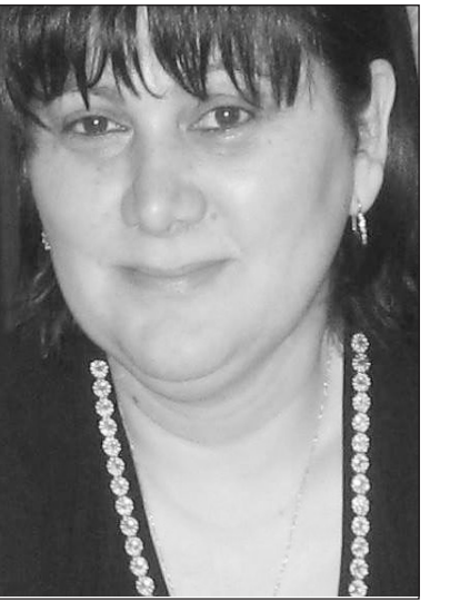
წვავებული და გამწარებული ცხოვრება მალამოს დაიდებდა და საჭირო რეფორმებს მალე ვეღვირებოდათ...“.

— განსაკუთრებული აქცენტი უნდა გაკეთდეს საზოგადოებრივ-პოლიტიკურ ცხოვრებაში ქალთა აქტიურობაზე. თანასწორობაზე. არაერთი განვითარებული ქვეყნის მაგალითით, თანასწორობა გაიგივებულია სოციალურ სამართლიანობასთან და ეს არის გზა პროგრესისკენ. ვაჟა-ფშაველა წერდა: „დღეს, რომ ძალიან ბიუროკრატიულ წრეებში ვაკვლიან ადგილებზე მინისტრებისა და სხვა, დედაკაცები იყვნენ, დღევანდელი გამ-