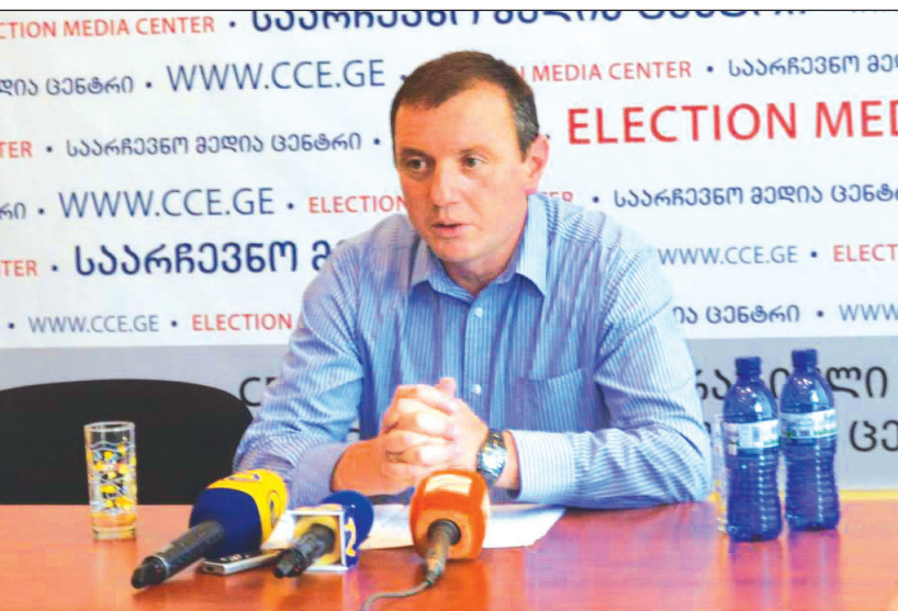
თავის ქმედებით არ დაუშვას პარტიის დისკრედიტაცია.

გარიცხვის მიზეზად ოქმში პარტიის მესამე მუხლია მითითებული: — ამ მუხლის თანახმად, პარტიის წევრმა მონაწილეობა არ უნდა მიიღოს საქმიანობაში და არ გააკეთოს განცხადება, რომელიც ეწინააღმდეგება პარტიის პოლიტიკურ კურსს, პოზიციას, მიზანს და ამოცანებს.