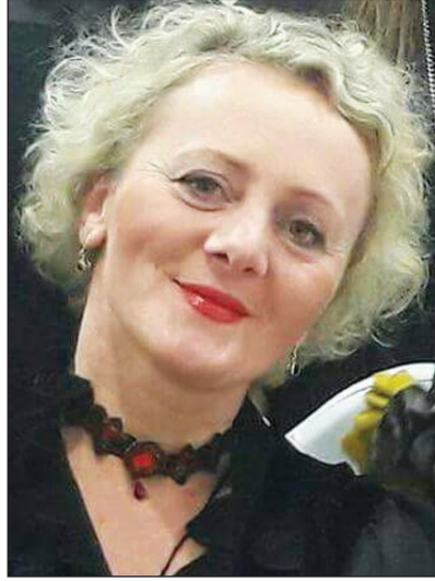
ეთაც აქტიური, საქმიანი, პოლიტიკოსი.

მინდა ყველა ქალმა დანახოს, როგორც მე, ასევე ყველა ქალს შეუძლია, მოუხედავად ოჯახური მოვალეობებით დატვირთული გრაფიკისა, იყოს ოჯახს გარ-