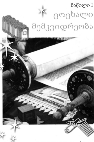
ნაწილი I ცოცხალი მემკვიდრეობა

დეკლარაციის ევსების მომენტში ფიჩხაძეს ნაღდი ფულადი თანხის სახით, 25 ათასი დოლარი; შვილს მარიკ შალონს კი LEUMI ISRAEL-ის დეპოზიტზე 100 ათასი დოლარი ჰქონდათ.