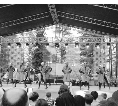
მზადება — დაგემოვნება. ფოლკლორის ფესტივალიში მონაწილეობდნენ ანსამბლები: „გახტანგური“, „იალინი“, „შემოქმედი“, „მხედრები“, „აისი“, „გურია“, „რეხეული“, „ურეკი“, „მანდილი“, „ზენაარი“, „ამალეა“, „ნართი“, ...

ალეონი. სოფელ შემოქმედში სახალხო დღესასწაული „შემოქმედობა 2017“ და რეგიონალური ფოლკლორის ფესტივალი „ფუძეობა“ გაიმართა, სადაც გურიის ოთხივე მუნიციპალიტეტის ფოლკლორული და ქორეოგრაფიული ანსამბლები, ასევე მგალობელ-მომღერალთა გუნდები იყვნენ წარმოდგენილი. გაიმართა ხალხური რეწვის ოსტატების ნამუშევრების გამოფენა და გურიული ტრადიციული კერძების მო-