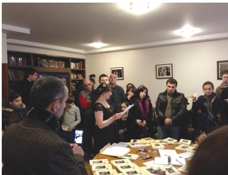
გიას სულის მოსახსენიებელი პარაკლისი და შემდგომი ლიტერატურული საღამო ლონდონში. 2013 წლის 21 აპრილი