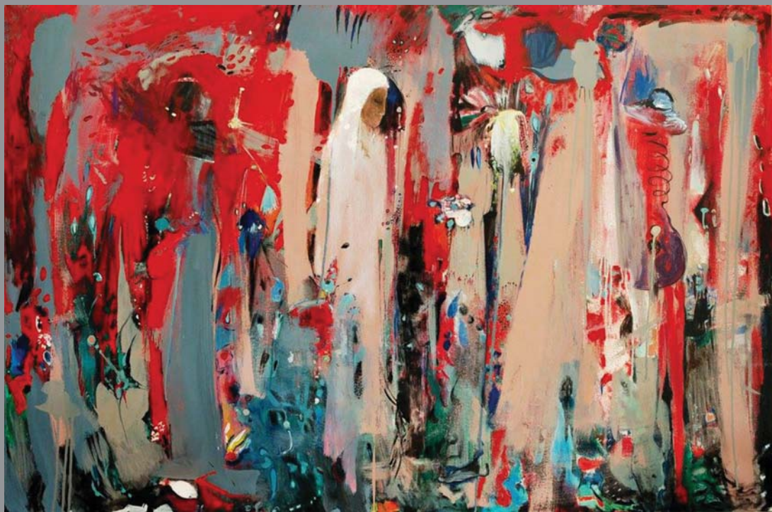
„შხვატაბაია მანკი“, (ტილო, აკრილი, 100/145 სმ.)