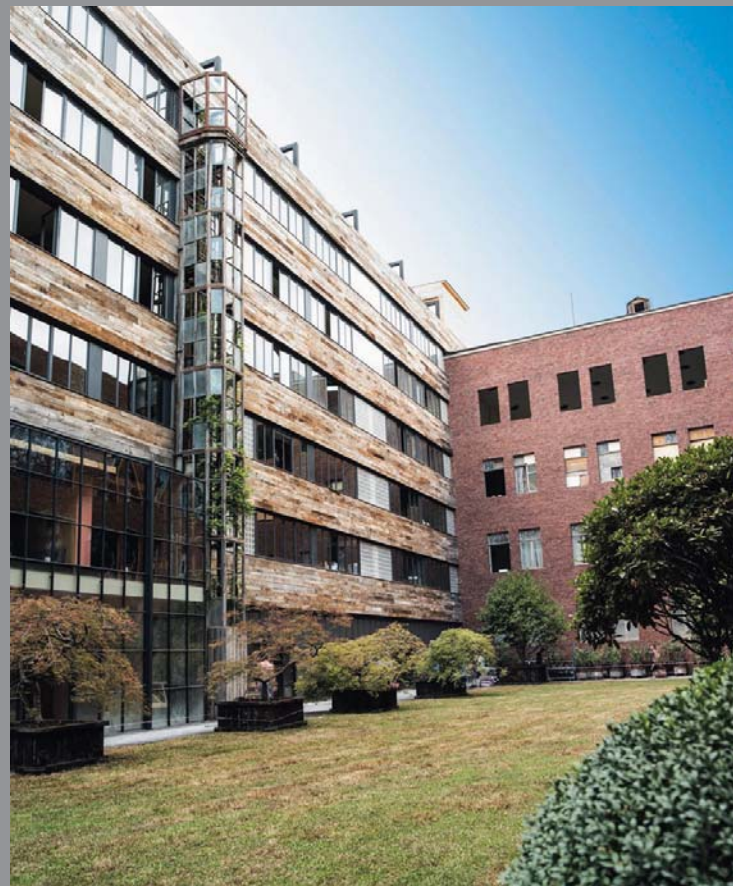
„Rooms Hotel თბილისი“