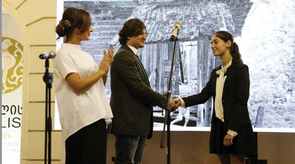
გობა ჩანადირი (ფოტოგრაფი)