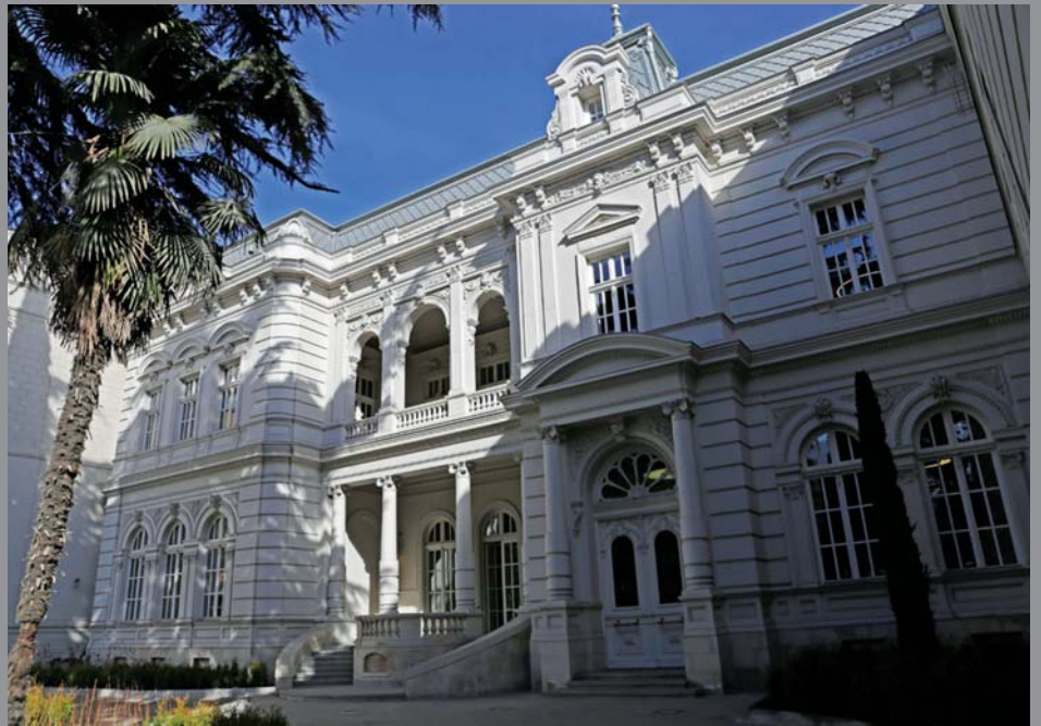
„ორბელიანების სასახლის რეკონსტრუქცია“