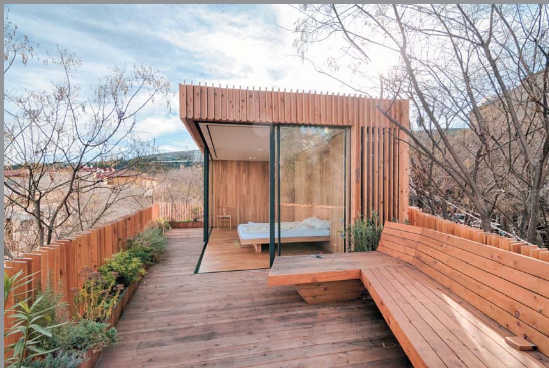
„არქიტექტურული ოფისი ჭონაძეაძე“