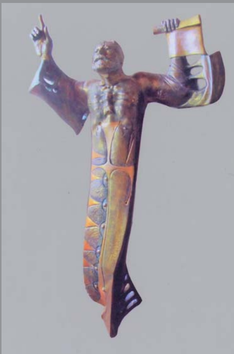
„ილია ჭავჭავაძის ფიგურატიული კომპოზიცია“