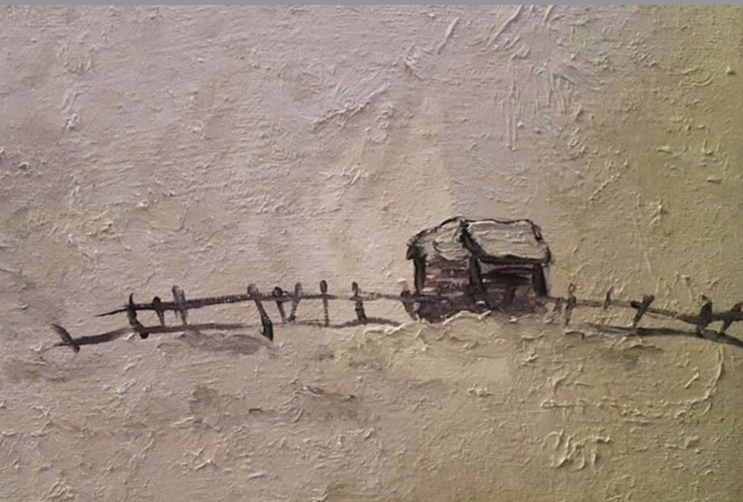
„მითოვებული სოფელი“, (ტილო, ზეთი)