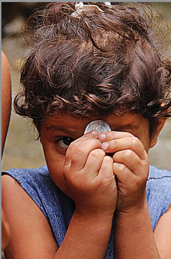
„თბილისის დეტალები — აგანოთუბანი“