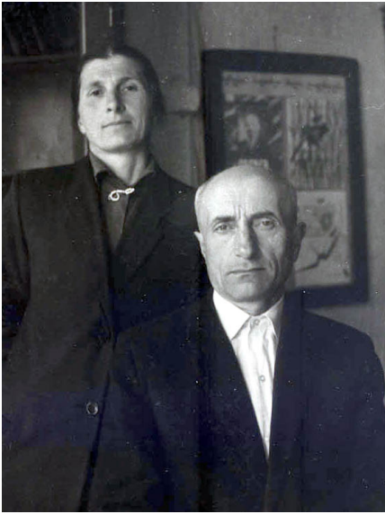
მშობლები: მერი და ბიქტორ შონიები

13 აგვისტოს 70 წელი უსრულდება შონიების საგვარეულოს ერთ-ერთ ღირსეულ წარმომადგენელს, პოეტსა და პუბლიცისტს, საქართველოს დამოუკიდებლობის აღდგენის აქტის ხელმომწერს ჯემალ ბიქტორის ძე შონიას.