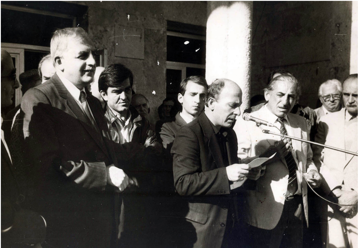
გალი, 1990 წლის სექტემბერი. ზვიად გამსახურდიასთან, მერაბ კოსტავასთან და გალელ თანამშრომლებთან ერთად

ცნობილ პოეტსა და საზოგადო მოღვაწეს, უზენაესი საბჭოს დეპუტატს ბატონ ჯემალ შონიას 70 წელი შეუსრულდა. ეს პატივსაცემი თარიღი მნიშვნელოვანია არა მხოლოდ იუბილარისთვის და მისი ოჯახისთვის, არამედ ჩვენთვის, ჯემალ შონიას მეგობრებისთვის და მასთან საქართველოსთვის, რადგანაც, გადაუჭარბებლად შეიძლება ითქვას, რომ ჯემალ შონიას ცხოვრებისეული კრედო, ქართული სიტყვის მსახურებასთან ერთად, სამშობლოს თავისუფლებისა და კეთილდღეობისთვის ბრძოლა გახლდათ. ზვიადისა და მერაბის იდეების ერთგულება ბიბლიურ რწმენასა-