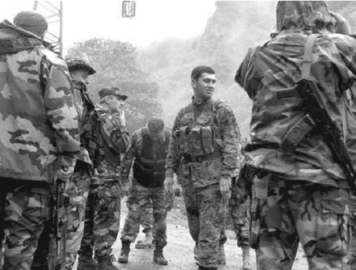
პანტანო ხარჩილაშა (დასასრული, დასაწყისი იხ. „სგ“ N30)

რაც შეეხება „გულუბრევილო“ სააკაშვილის მიერვე გაქვრებული ვერსიას, რომ საქართველო პროვოკაციაზე წამოაგვს, თუ კარგად მივაყურადებთ 5-6-7 აგვისტოს სააკაშვილის მიერ გაკეთებულ განცხადებებს, ეს განცხადებები არაფრით არ ჰგავს პროვოკაციაზე წამოგებული და შეცდომაში შეყვანილი კაცის განცხადებებს.