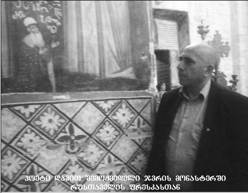
კომპიტი დავით შემოქმედელი ჯვრის მონასტაში რუსთაველის ფრანკონია

რუსთაველის საზოგადოების დელეგაციის ვიზიტი წმინდა მიწაზე