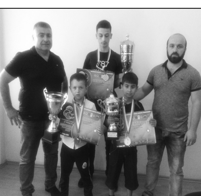
პოვეს. 8-9 წლის ასაკის მონაწილეობა შორის (+22კგ) ჩემპიონი

აღნიშნული ტურნირი წარმატებული გამოდგა ქ. ოზურგეთის მუნიციპალიტეტის გაერთიანებული სპორტის განვითარების ცენტრის „შოტოკან კარატე-დო“-ს გუნდისთვის და მათ ჯგაში 4 მედალი მოი-