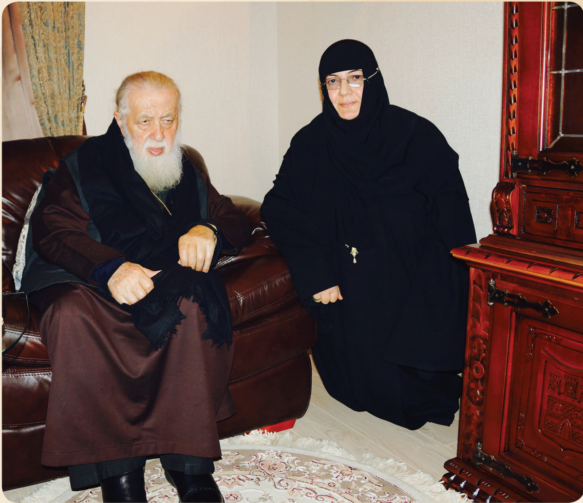
კათოლიკოს-პატრიარქი ილია II და სამთავროს ილუმენია ქეთევანი

ქართულ საგალობელს მადლი დაეფინა, სული იბერული სუნთქავს სამზიანოს; ზეცით დაფერილი წმიდა თვალები გაქვს, სულის სითეთრეში მადლი დაგფრთიანობს.