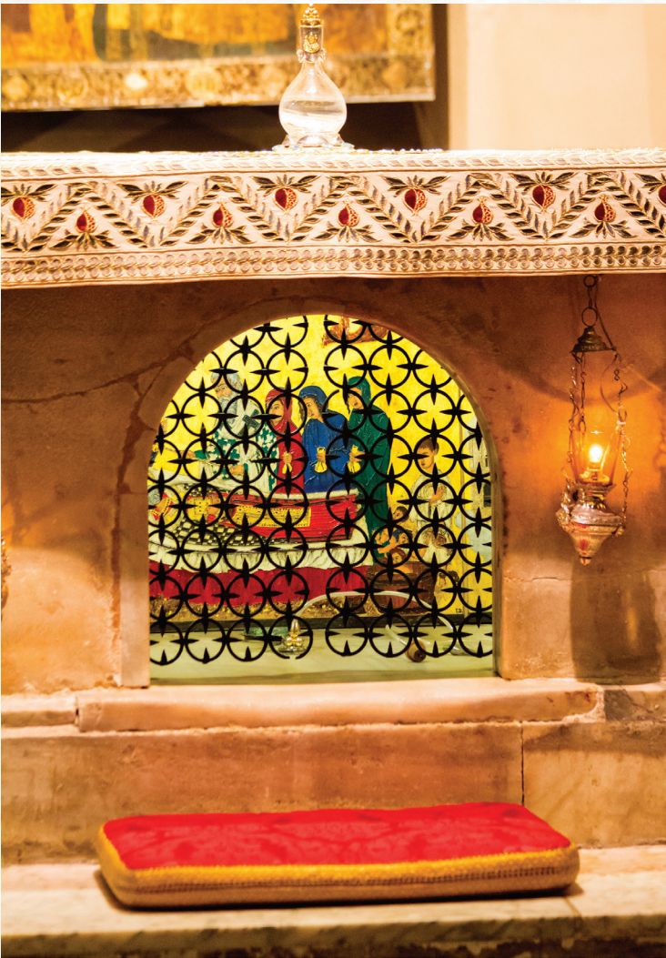
წმიდა ნიკოლოზის საფლავი ქალაქ ბარში

წმიდა მღვდელმთავარი ნიკოლოზი უდიდესი მფარველი და მეოხია თითოეული მორწმუნე ქრისტიანისა. მისი მსწრაფლშემწეობა და სასწაულთმოქმედება მთელ მსოფლიოშია ცნობილი. ქართველებმა წმიდა ნიკოლოზისადმი განსაკუთრებული სიყვარული იმით გამოხატეს, რომ მას სრულიად საქართველოს კათოლიკოს-პატრიარქმა ილია II-მ ივერიის ეკლესიის მესაჭეობა ჩააბარა და ქართველი ერის მფარველობა მიანდო. „არ ყოფილა შემთხვევა, ვინმეს ღოცვით მიემართოს წმიდა ნიკოლოზისათვის და მას არ შეესრულებინოს. იგი ისეთი მოწყალეა, რომ სხვა სარწმუნოების წარმომადგენლებს, მაჰმადიანებსაც კი უსრულებს თხოვნას.“ –