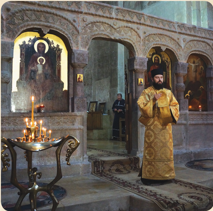
ბერდიაკონი ილია სამთავროში მსახურებისას

უწმიდესისა და უნეტარესის, სრულიად საქართველოს კათოლიკოს-პატრიარქის, მცხეთა-თბილისის მთავარეპისკოპოსისა და ბიჭვინთისა და ცხუმ-აფხაზეთის მიტროპოლიტის ილია II-ის ლოცვა-კურთხევით 2017 წლის 12 ივლისს, პეტრე-პავლობის