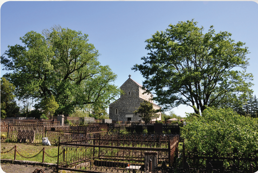
ბანძა-ვედიდკარის ეკლესია და ფალავების საგვარეულო სასაფლაო