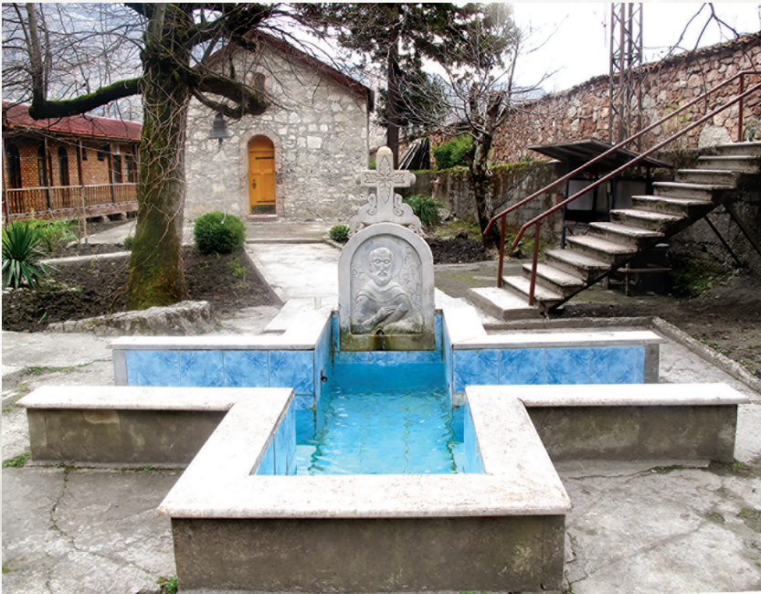
ცაგერის წმიდა მაქსიმე აღმსარებლის მამათა მონასტერი

ადგილიდანაა გადმოსვენებული, ხოლო ის, რომელიც მათ ქვემოთ განისვენებდა, როგორც ჩანს, თავიდანვე აქ იყო დასაფლავებული. უნდა აღინიშნოს, რომ მათ შორის დაშორება მინიმალურია – 1-2 სმ. ისინი, როგორც ჩანს, ბერები არიან, მუხლის თავების ძვლები ძაღზე დაცვეთილია, სავარაუდოდ, მუხლებზე ხანგრძლივი დგომით.