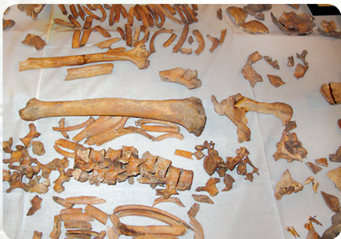
ღირსი მაქსიმე აღმსარებლის წმიდა ნაწილები

ქართველი ანთროპოლოგის, თბილისის სახელმწიფო უნივერსიტეტის პროფესორის, ვლადიმერ ასლანიშვილის დასკვნიდან ჩანს, რომ ნაპოვნ ნეშტთაგან სამი აშკარად სხვა