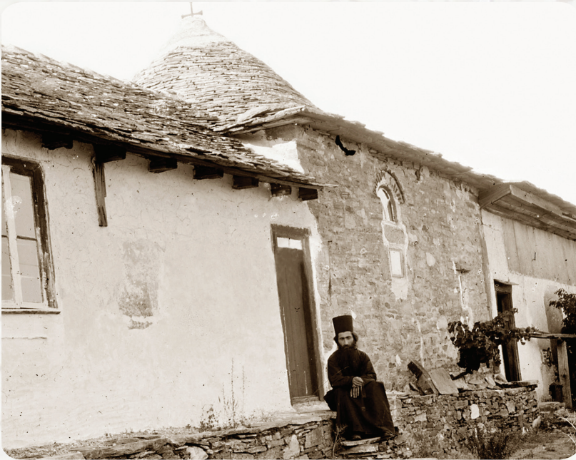
ათონის მთა. წმიდა ილია წინასწარმეტყველის სენაკი.

1928 წლის 25 დეკემბერს იგი ვარძიის მონასტრის წინამძღვრად დაინიშნა. 1929 წლის 11 იანვარს არქიმანდრიტის წოდება მიენიჭა, 13 იანვარს გორის საკათედრო ტაძარში ურბნელმა ეპისკოპოსმა სვიმეონმა (ჭელიძე) შეასრულა წესი არქიმანდრიტის წოდების მინიჭებისა. მამა ილიასვე დაევალა მახლობელი სოფლების მოვლა-პატრონობა და ქრისტიანული წესების შესრულება. იგი 17 იანვარს ჩავიდა ახალციხეში და აპირებდა ვარძიის მონასტრის ჩაბარე-