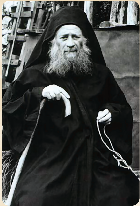
ბერი იოსებ ისიხასტი

მოძღვარი დიონისე: „შენმა ბერმა ყველაფერი უნდა იცოდეს შენ შესახებ, ყველაფერი მისი კურთხევით უნდა აკეთო. შენზე უმცროს მონოზენებს ისე შეხედე, თითქოს შენზე 15 წლით უფროსნი არიან. თუკი ლიტურგიის დროს რაიმეს გაკეთებას დაგავალებენ, არ შეეწინააღმდეგო, წადი და გააკეთე, თან იესოს ლოცვა აღასრულე (საერთოდ, მონოზონი ყოველთვის უნდა ამბობდეს იესოს ლოცვას.) და იცოდე, რომ ანგელოზი წირვაზე მდგომთა შორის პირველთა სიაში ჩაგწერს. ასე შინაგან მშვიდობასაც შეინარჩუნებ და სხვებთანაც მშვიდობა გექნება. არ უნდა ვიქცეთ დაბრკოლების მიზეზად“.