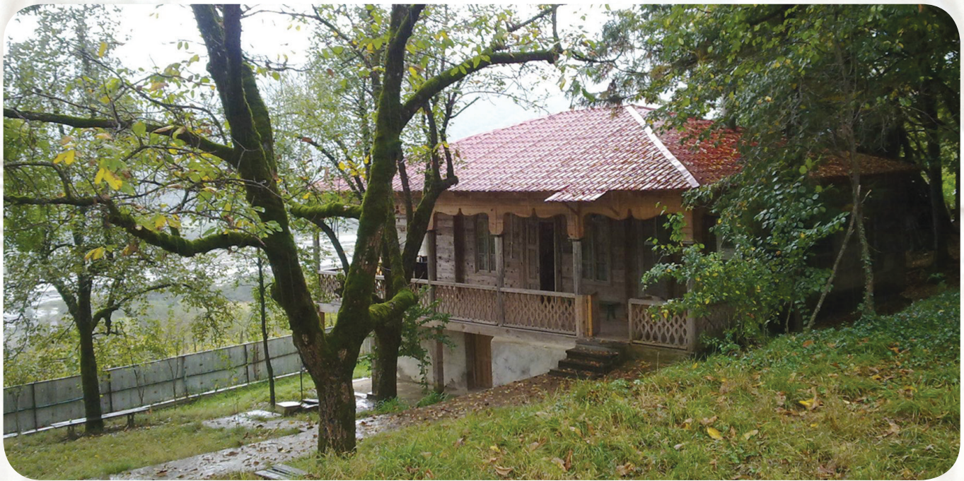
ბარდნაღა. ლადო ასათიანის სახლ-მუზეუმი

ქართულ პოეზიაში ლადო ასათიანის მიერ დატოვებულ სინათლეზე გურამ ასათიანი ამბობდა, ეს სინათლე არასოდეს ქრება და თან უჩვეულო სითბოს გამოსცემს, ლადო ასათიანის სტრიქონებს თითქოს ალმური ასდისო. ეს მისი მშფოთვარე სული უმღეროდა საქართველოს ლურჯი ცისთავანს და უფლისციხესთან გაშლილ ყაყჩოებს. პოეტთან ერთად მისი სტრიქონებიც მარადიულ ახალგაზრდებად დარჩნენ. თითქოს თავის ცხოვრებაზე ლაპარაკობს ლადო ვაჟა-ფშაველასადმი მიძღვნილ ლექსში: