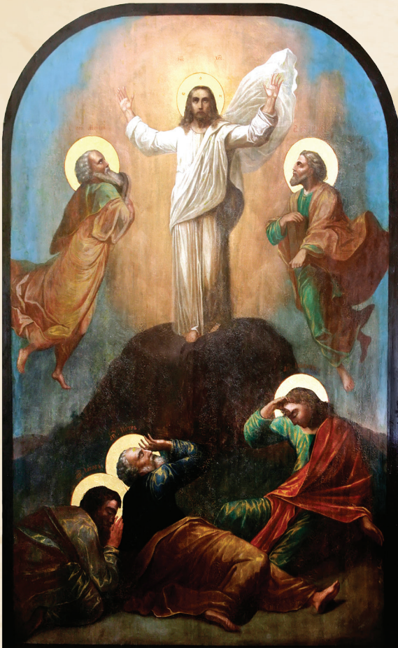
სამთავროს ფერისცვალეზის კანკელის ხატი

„წარიყვანნა იესო პეტრე და იაკობ და იოჲანე, ძმაჲ მისი, და აღიყვანნა ივინი მთასა მაღალსა თჳსაგან. და იცვალა მათ წინაშე სხუად ფერად და გაბრწყინდა პირი მისი, ვითარცა მზე, ხოლო სამოსელი მისი იქნა სპეტაკ, ვითარცა ნათელი“ (მთ. 17.1-2).