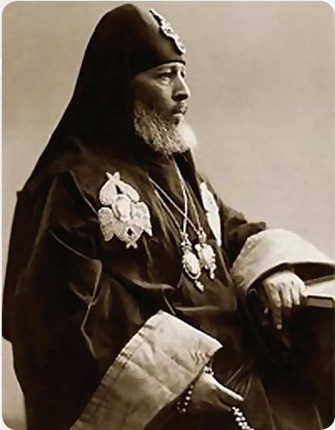
წმიდა მღვდელმთავარე კირიონი (საბაგლიშვილი)

განა მხოლოდ კირიონ კათალიკოსს მოვექცით ასე? უფრო მეტის სისასტიკით გავისტუმრეთ საიქიოს დიდი ილია! წიწამურისა და მარტყოფის ტრაგედია საქართველოს დაუძინებელი მტრების მიერ ჩვენში დათესილმა, ერთმანეთის ჯგუფურმა გადაკიდება-კინკლაობამ შეამზადა. მტრებმა დაგვქაქეს, ერთმანეთის მტრებად გადაგვაქციეს, საკუთარ ოჯახში შინაური მტრები და ჯაშუშები გაგვიჩინეს და ეს თავზარდამცემი უბედურება ქართველების ხელით გააკეთეს. რაღა გვეთქმის ამ შავბნელ ბოროტებაზე? – შური, ერთმანეთის მძულვარება და გაუტანლობა დაესადგურა