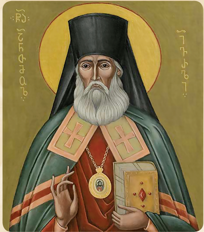
წმიდა ანთიმოზ ივერიელი

ამიტომაც, ჩემო საყვარელნო, აღვმართოთ ჩვენი გონება თაბორისაკენ, ჩვენკენაც მოვიდეს ნათელი ჭეშმარიტი, ვიხილოთ ის სულიერი თვალით, ვიყოთ მოციქულებივით ქრისტეს მიმართ საგსენი მოშურნეობითა და სიყვარულით, დავემსგავსოთ მოსეს და ილიას მათ ღვაწლსა და ღვთის მცნებების აღსრულებაში, რათა ჩვენც ქრისტესთან ერთად ავმადლდეთ სულიერ სიმაღლეზე, ვიხილოთ მისი