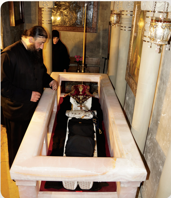
არქიმანდრიტი კირიონი ღირსი მამა გაბრიელ აღმსარებლისა და სალოსის ნაწილებთან

საკვირველი მამაა. თანამედროვეები მას კიდევ ვერ აღვიქვამთ ისე, როგორც მომავალი შეაფასებს. არიან წმიდანები და დიდება მათ, მაგრამ არიან ეპოქალური მნიშვნელობის წმიდანები და ასეთი იყო მამა გაბრიელი. მჯერა, რომ მისი სახელი ჩვენს ერს, დედა ეკლესიას საუკუნეების განმავლობაში გაჰყვება. როდესაც მამა გაბრიელმა 1965 წლის 1 მაისს წითელი ბელადის უზარმაზარი სურათი ცეცხლს მისცა და უფალი იესო ქრისტე აღიდა, ამით დაამხო კაცობრიობის ისტორიაში ჯერ არნახული უღმერთობის – ღმერთის, სულის არსებობისა და მარადიული ცხოვრების უარყოფელი კერპი.