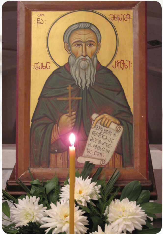
წმიდა მაქსიმე აღმსარებელი

ამის შემდეგ, უწმიდესისა და უნეტარესის, სრულიად საქართველოს კათოლიკოს-პატრიარქის, მცხეთა-თბილისის მთავარეპისკოპოსისა და ბიჭვინთისა და ცხუმ-აფხაზეთის მიტროპოლიტის ილია II-ის ლოცვა-კურთხევით დაიწყო არქეოლოგიური კვლევა სოხუმის სახელმწიფო უნივერსიტეტის პროფესორ რ. ხვისტანის ხელმძღვანელობით. თავდაპირველად გაითხარა საკურთხეველი, სადაც აღმოჩნდა ერთმანეთზე დაწყობილი