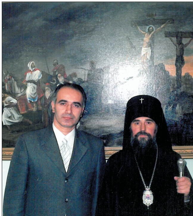
სტუმრად ბაშკირეთის რუსული ეკლესიის ეპარქიის არქიეპისკოპოს ნიკონთან. 2003 წლის დეკემბერი.