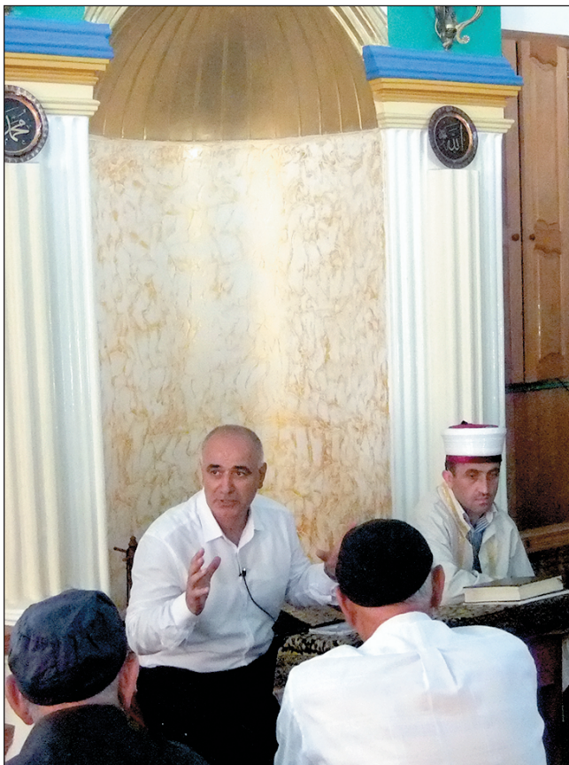
შეხვედრა მუსლიმან მრევლთან ბათუმი, ჩაქვის მეჩეთი, 30.06.2016