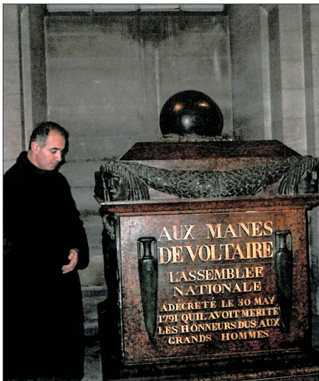
ფრანგი განმანათლებლის, ფილოსოფოს ვოლტერის საფლავთან. პარიზი, 2003 წლის ოქტომბერი.