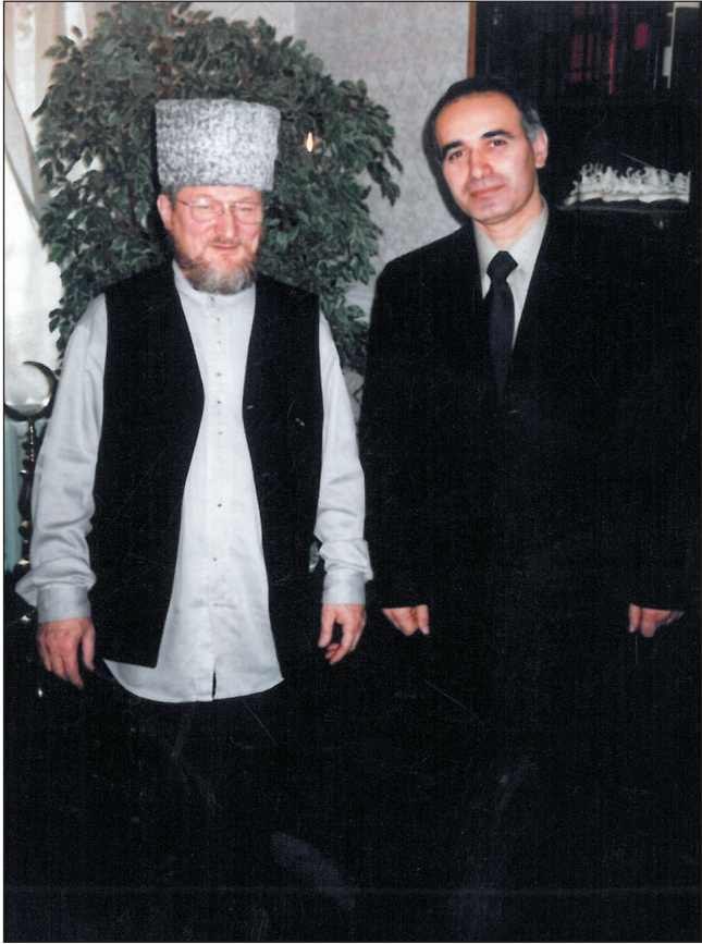
სტუმრად რუსეთის მუსლიმანთა საზოგადოების უმაღლეს მუფთთან ტალგატ ტაჯუდინთან. ქ. უფა, 2002 წლის დეკემბერი.