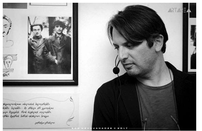
ბოდა და განახორციელა კიდევ თავისი ჩანაფიქრი 1959 წლის 17 მარტს.

თენგიზ მირზაშვილის (ჩუბჩიკას) სახლში გაჩნდა იდეა, რომ გალაკტიონის თვითმკვლელობის ადგილას, სადაც პოეტი დაეცა, დაგვედო ქვა და გავგვეკეთებინა წარწერა... 2010 წლის 17 მარტს, ამ ადგილას, გავხსენით გალაკტიონის ობელისკი. ასეთი პოეტი საუკუნეში მხოლოდ ერთხელ იბადება. გალაკტიონმა უმდიდრეს ცხრაკლიტულებს მორაგო გასაღები და პოეტური აზროვნების უმაღლეს ნეტარებას გვაზიარა. ბევრი საიდუმლო ამოგვისხსნა და კითხვის ნიშნებიც ბლომად დაგვიტოვა“.