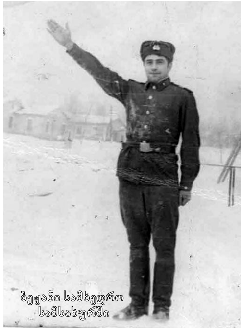
ბეჟანის სამხედრო სამსახურში

ყველა ეს სახე პოეტების მეფესთან მიმანიშნებელია მუხანათი მეზობლის, თოვლიან – ყინულიანი იმპერიის სატანურ, მზაკვრულ პოლიტიკაზე, მის ავ ზრახვებზე. ლექსში „ოფორტი“ გალაკტიონი ენიგმებით მიგვახვედრებს, რომ ჩვენი სამშობლო ჩრდილოეთის ავდრიანი, ცივი იმპერიის მიერ დამონებულია და ეს მონსტრი გვაიძულებს, თავისი თოვლიან–ყინულიანი სა-