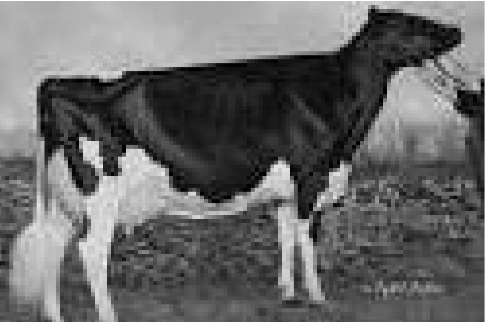
ქენჯნის თვითგვემში გამოგლოვილი „ხარსა მეკალოესა პირსა ნუ დაუკრავ“.

„ვერ მოერევი შენ იმას, ვინაც დღე გამოწყვილიდა“.