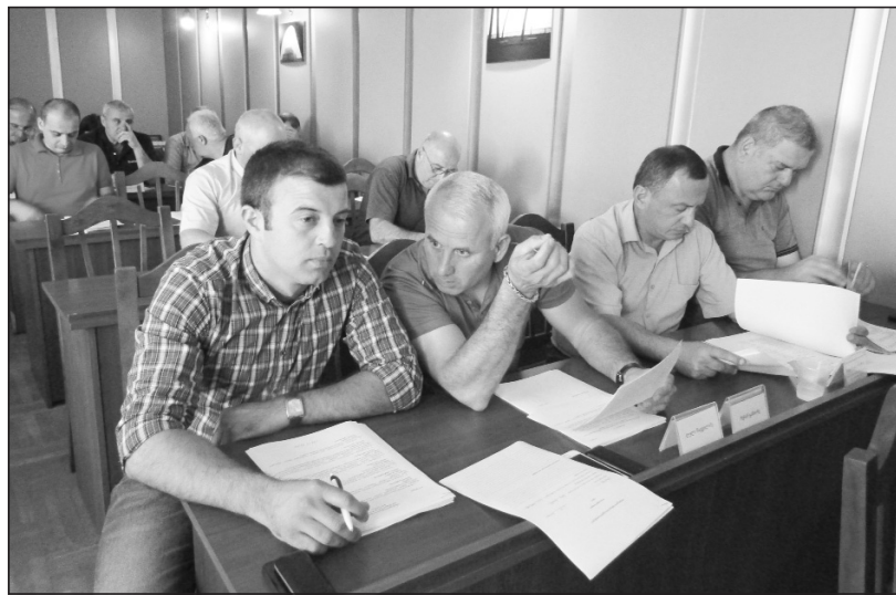
„ოზურგეთის მუნიციპალიტეტის გამგეობის თანამდებობის პირთა და გამგეობის მოხელეთა თანამდებობრივი სარგოების ოდენობის განსაზღვრის შესახებ და 2015 წლის 8 იანვრის №2

ლით გათვალისწინებული პასუხისმგებლობა“. დაამტკიცეს არასამეწარმეო (არაკომერციული) იურიდიული პირის ოზურგეთის მუნიციპალიტეტის მომსახურების ცენტრში ადმინისტრაციულ სამართალდარღვევათა საქმის წარმოებისათვის დოკუმენტების ტიპური ფორმები და მათი აღრიცხვა-ანგარიშგების წესი. მიიღეს დადგენილება არასამეწარმეო (არაკომერციული) იურიდიული პირის ოზურგეთის მუნიციპალიტეტის საზოგადოებრივი ჯანდაცვის ცენტრში ადმინისტრაციულ სამართალდარღვევათა საქმის წარმოებისათვის დოკუმენტების ფორმების და აღრიცხვა-ანგარიშგების წესის დამტკიცების შესახებ“, ასევე „ოზურგეთის მუნიციპალიტეტში გარე ვაკრობის რეგულირების შესახებ“. ცვლილება შეიტანეს ოზურგეთის მუნიციპალიტეტის საკრებულოს 2015 წლის 8 იანვრის №3 დადგენილებაში