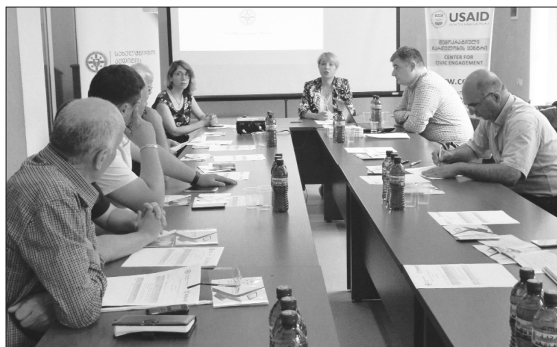
7 ივლისის ქალაქ ოზურგეთში, დემოკრატიული ჩართულობის ცენტრში სახელმწიფო აუდიტის სამსახურის წარმომადგენლებმა საჯარო შეხვედრა გამართეს დაინტერესებულ მხარეებთან. შეხვედრაზე განიხილეს სახელმწიფო

აუდიტის სამსახურის მიერ მუნიციპალიტეტებში ჩატარებული აუდიტების შედეგად გამოვლენილი ძირითადი ხარვეზები და გაცემული რეკომენდაციები. შეხვედრის მონაწილეებს ასევე გააცნეს აუდიტის სამსახურის ახალი ინოვაციური ვებპლატფორმის - ბიუჯეტის მონიტორის ( www.budget-monitor.ge ) შესახებ ინფორმაცია. როგორც შეხვედრაზე ითქვა, ბიუჯეტის მონიტორი საკრებულოს წევრებს, სამოქალაქო საზოგადოების წარმომადგენლებს, დაინტერესებულ ექსპერტებსა და მოქალაქეებს აძლევს უნიკალურ შესაძლებლობას, აირჩიონ მათთვის საინტერესო სფერო და მიიღონ მუდმივად განახლებადი და სანდო ინფორმაცია თითოეული მუნიციპალიტეტის შემოს-