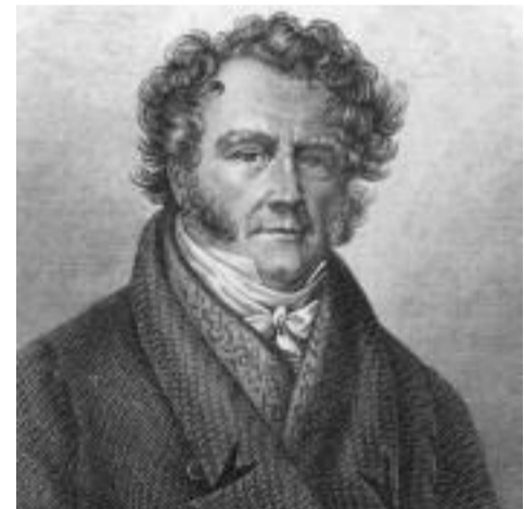
"ერთადერთი გრძნობა, რომელიც დამნაშავე შეიძლება პოლიციელს გაუღვივოს – დაცინვა და გაოგნება" – ვენი ვილოკი

გამოძიების სფეროში კრიმინალისტიკა უდიდეს როლს ასრულებს. სხვადასხვა ანალიზებითა და ექსპერიმენტებით ექსპერტები დანაშაულის გახსნას და დამნაშავის დაკავებას ცდილობენ. თანამედროვე ტექნოლოგიებმა კრიმინალისტიკას წარმოუდგინებელი შესაძლებლობები მისცა. დრო, როდესაც დამნაშავის დაჭერისას გამოძიებლები მხოლოდ თითის ანაბეჭდების იმედზე იყვნენ, დიდი ხანია წარსულს ჩაბარდა.