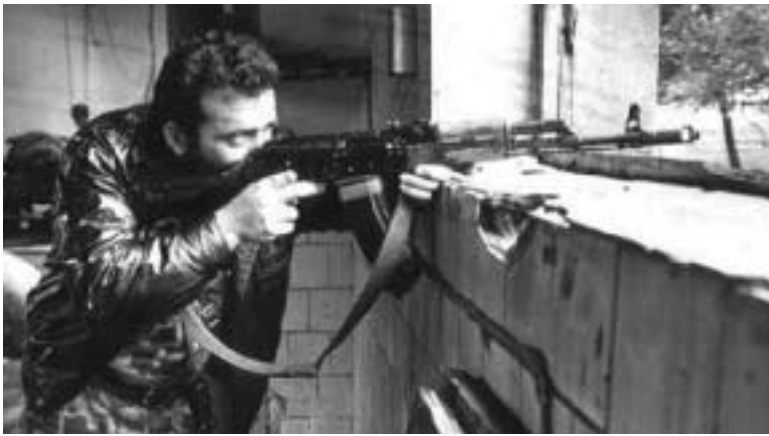
← 4 გვ.

და, რომ მოთხოვნილებაც იყო. ეს კიდევ ერთი ნიშანია იმისა, რომ რუსმა ქართველებს სახელმწიფოებრიობა დიდი ხნის წინ წაგვართვა. სახელმწიფოებრივად აზროვნების შემთხვევაში ასეთ რეკლამას არცერთი სახელმწიფო არ გაუშვებდა. წარმოდგინეთ, დღეს, ისრაელში რომელიც მუსულმანურ სამყაროსთან საომარ მდგომარეობაშია, ისრაელის მოქალაქემ, სამხედრო თვალსაზრისით, თავის ვალდებულება რომ არ შეასრულოს, მოქალაქეობას ართმევენ. ჩვენები კი იმის ნაცვლად, რომ თავისიანებს საომარ მოქმედებებში დახმარებოდნენ, დასასვენებლად ღუბაში დადიოდნენ.