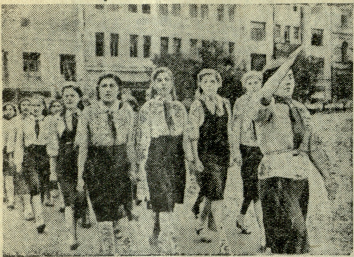
Свыше двадцати тысяч тбилисских ребят приняли участие в общегородском параде пионерских дружин, состоявшемся 24 октября в честь 25-летия ленинско-сталинского комсомола. Длинной красочной лентой вдоль всего проспекта Руставели растянулись колонны жизнерадостной молодежи. Под звуки духового оркестра стройными рядами, четко отбивая шаг, порайонно проходили пионерские отряды мимо трибуны. На снимке: ученицы 29 женской средней школы на параде.