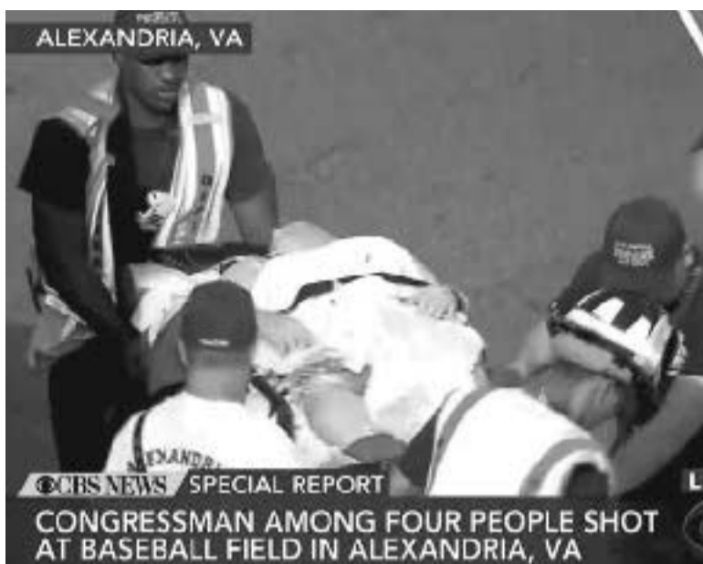
CONGRESSMAN AMONG FOUR PEOPLE SHOT AT BASEBALL FIELD IN ALEXANDRIA, VA

სამყაროში დასადაგრებულმა პოლიტიკურმა ქაოსმა რადიკალიზმს გაუხსნა გზა. სამწუხარო ფაქტია, რომ ნებისმიერი პოლიტიკური საკითხის გადაწყვეტამ ძალისმიერი მეთოდების გამოყენებით დაიძვედა ადგილი. ამის თქმის საფუძველს აშშ-ში კონგრესმენ სანდერსზე განხორციელებული თავდასხმაც გვაძლევს საფუძველს. კონგრესმენი, საბენდიეროდ, გადარჩა, თუმცა ჯერ კიდევ მოუწევს საავადმყოფოში ყოფნა. რა გახდა მასზე შეიარაღებული თავდასხმის მიზეზი, უცნობია, რადგან მკვლეელი პოლიციამ დაჭრა, თუმცა მისი გადარჩენა ექიმებმა ვერ შეძლეს. აქედან გამომდინარე, უნდა ვივარაუდოთ, რომ თავდასხმის ზუსტ მიზეზს ვერ გავიგებთ, რადგან შემსრულებელი ლიკვიდირებულია. მის გარეშე კი შემკვეთებზე (თუ არსებობდნენ) გასვლა გამოძიებას გაუჭირდება.