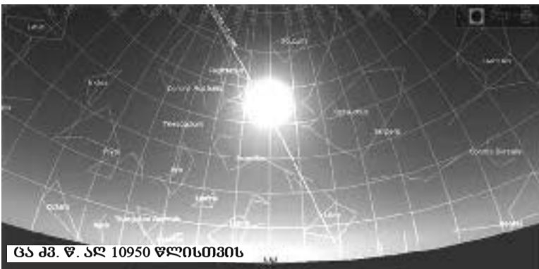
ცნ. მ. წ. აღ 10950 წლისთვის

შეიძლება მიიჩნეოდეს, რომ გიბრე-ლე-თეფეს ნაგებობები მხოლოდ და მხოლოდ საკულტო დანიშნულებით ააგეს და ისინი დედამიწის უძველესი ტაძრები უნდა ყოფილიყვნენ. „ტაძრები“ არ ჰგავდა მანამდე აღმოჩენილ არც ერთ ნაგებობას. T-ს ფორმის 3,5-7 მ კიბრეის მონოლითური სვეტები განლაგებულია წრიულად (დიამეტრი მერყეობს 10-იდან 20 მეტრამდე). მონოლითებს შორის კედელი ამოყვანილია ქვებით, ხოლო ცენტრში მოთავსებულია ასევე T-ს ფორმის ორი სვეტი, რომელიც სიმაღლით აღემატება დანარჩენებს. გაურკვეველი იყო ვის ეკუთვნოდა მდიდრულად შემკული მონოლითები და რეალურად რას წარმოადგენდა. მკვლევარების აზრით, ყველაზე მსხვილი ცენტრალური მონოლითები ჰგავდნენ სტოუნჰენჯის ქვის ფილებს, მაგრამ 6 000 წლით „ხნიერები იყვნენ“. ყველა შემთხვევაში გაურკვეველი დარჩა ის, რომ ნეოლითი ხანაა, როდესაც ადამიანებმა არ იციან არც მესაქონლეობა, არც მიწათმოქმედება და ასეთ რამეს ასეთ დონეზე რაანირად ქმნიდნენ? „როგორც ჩანს, მეცნიერებს მოუწევთ ხელახლა გადაწერონ ადრეული ისტორიის მნიშვნელოვანი თავები“, – აღნიშნა ა. კოლხევი.