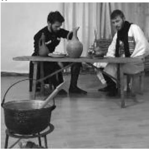
„აფხაზეთობის“ დღესასწაულთან დაკავშირებით, სენაკში მოქმედი აფხაზეთის თემურ ბოქუჩაგას სახელობის საჯარო სკოლაში სპექტაკლის ჩვენება მოეწყო. მე-10 და მე-11 კლასის მოსწავლეებმა აკაკი წერეთლის „გამზრდელი“ აფხ-

აზურ ენაზე, დიმიტრი გულიას თარგმანის მიხედვით დადგეს. ენის პედაგოგის თქმით, რომელსაც ვინაობის დასახელება არ სურს, სპექტაკლისთვის ერთი თვის განმავლობაში ემზადებოდნენ. ამ ყველაფერში მას სკოლის ადმინისტრაცია და ქართული ენის პედაგოგები დაეხმარნენ. წარმოდგენის თემატიკად „გამზრდელი“ იმითმ შეარჩიეს, რომ ის ქართულ და აფხაზურ ტრადიციებს ეხება, მათ შორის მეგობრობას, სიყვარულს, გამზრდელისადმი ღრმა პატივისცემას. „თავისი სტრუქტურით აფხაზური ენა ძალიან რთულია. ძალზე რთულია ზოგიერთი ბგერის გამოთქმა, მაგრამ სპექტაკლში მონაწილე ბავშვები ძალიან ცდილობენ, სწავლობენ. მათ აინტერესებთ“, – უთხრა „ლაივპრესს“ აფხაზური ენის მასწავლებელმა. ენის ბარიერი რომ არსებობდა, ამის შესახებ სპექტაკლის მონაწილეებიც ყვე-