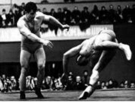
დღევანდელ ტრადიციულ საკვირაო მოგონებებში ერთ ცნობილ ქართველ ფალავანს გურამ საღარაძეს და მის სპორტულ კარიერას გავიხსენებთ.

მსოფლიო პირველობების ორგანიზაციის გამარჯვებული და ტოკიოს ოლიმპიური თამაშების ვერცხლის მედალოსანი იმ დროს მსოფლიოს ერთ-ერთ უძლიერეს მოჭიდავედ ითვლებოდა. მართალია ოლიმპიურ ჩემპიონობას ვერ შესწავდა, მაგრამ ამ მიზანს მოგვიანებით მაინც მიაღწია. რაც თავის დროზე გურამ საღარაძემ ვერ მოახერხა, მისმა გავრთინილმა დავით გობჯიშვილმა შეძლო და ოლიმპიურ ოქროს დაუფლა. ბატონი გურამ საღარაძე დღეს ჩვენი სტუმარია.