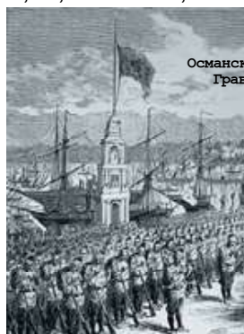
Османские войска в Батуми. Гравюра начала XX века.

Протокол заседания политической комиссии Московской российско-турецкой конференции: "10 марта 1921 г. Заседание открывается в 19 час. 30 мин. Присутствуют: члены турецкой делегации: Юсуф Кемаль Бей, Виза Нур Бей, Али Фуад Паша; члены российской делегации: Чичерин, Коркмасов. Председательствует Юсуф Кемаль Бей.