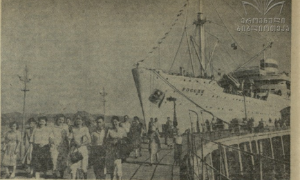
ჩვენი ქვეყნის სხვადასხვა ქალაქში მრავალი ტიპის ჩამოსხმის ხაზები...