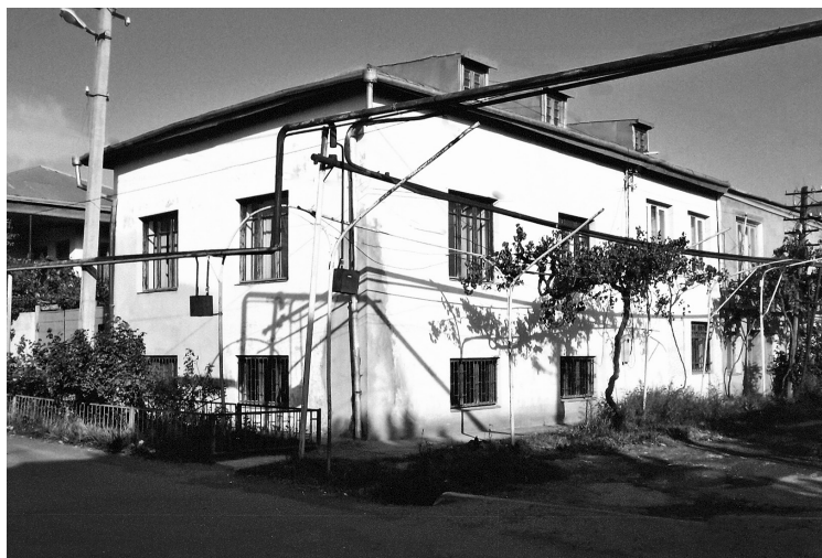
გორში, ნინოშვილის ქუჩა 90-ში კათოლიკე მრევლის ამჟამინდელი შეკრების ადგილი, სამლოცველო სახლი. ქვემოთ, ინტერიერი.