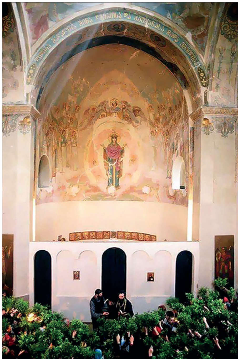
გორის კათოლიკური ტაძრის ინტერიერი 90-იან წლებში, ჯერაც შემორჩენილია ტაძრის ფრესკები