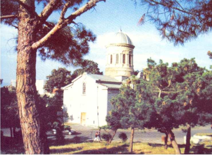
გორის კათოლიკური ტაძარი თუშინდელი სახით