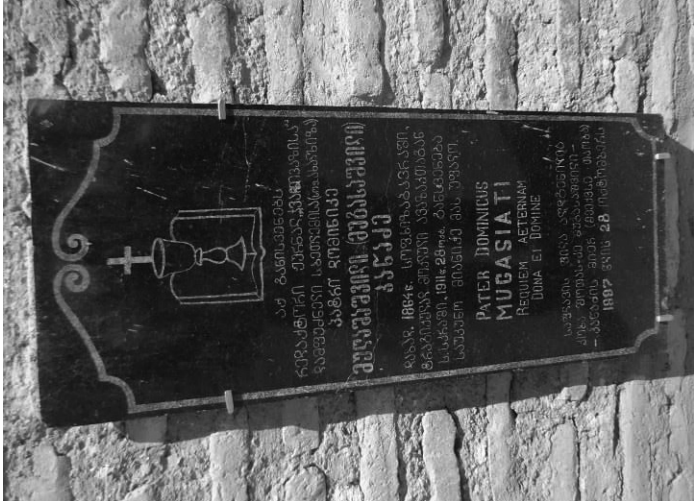
მამს ღომინიკე სტუღოვის ქვა