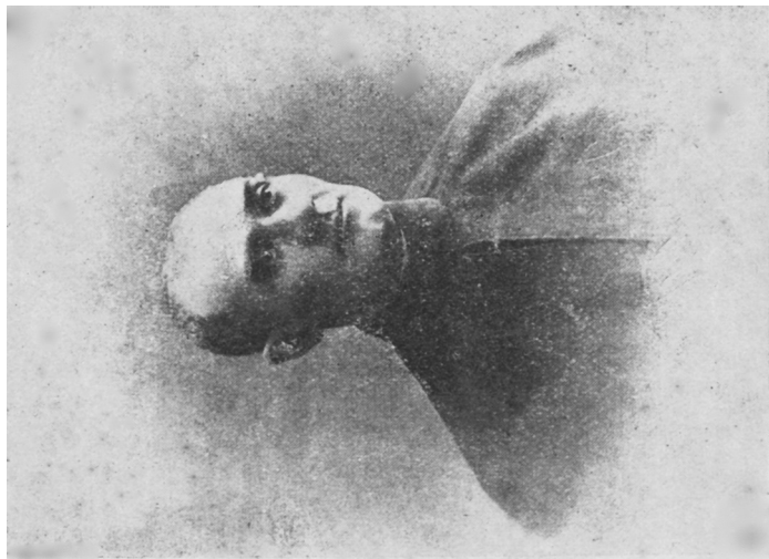
მამს ღომინიკე მუღლანსუგლი-ჭაწაბე (1864–1911)