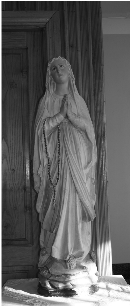
ლურდის ღვთისმშობლის ქანდაკება გორის ეკლესიიდან