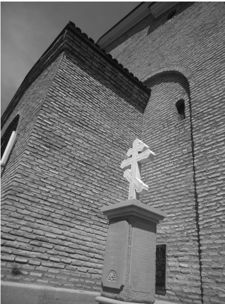
ანბლი სტელა, რომელზეცაა საუბნარი 118-121 გვერდებზე