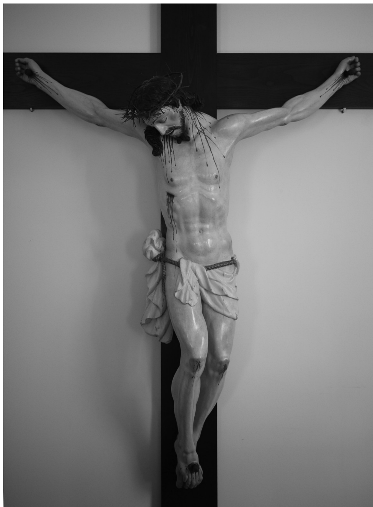
ჯვარცმან გორის ეკლესიიდან