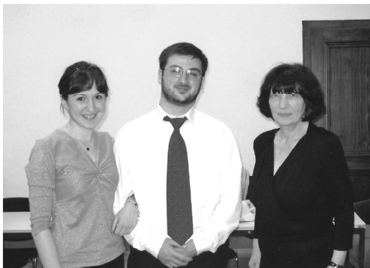
ნათია და დარი მსოფლიოში სახელგანთქმულ ქართველ პიანისტ – ელისო ვირსალაძესთან, სტუმრად, მიუნხენში