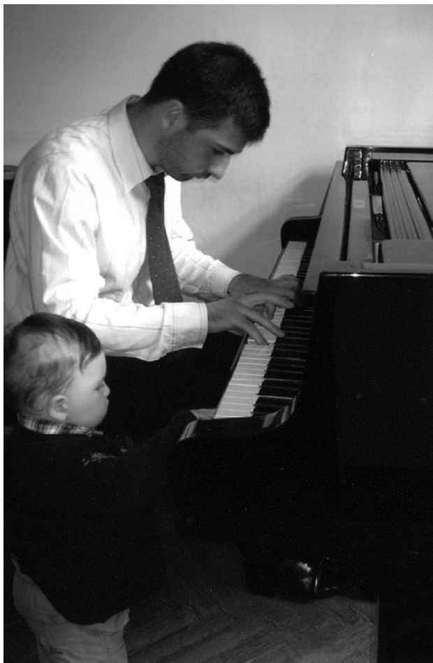
კონცერტის წინ „ერთად გადიან რეპეტიციას“ დაჩი და მომავალი პიანისტი, მისი პატარა ლუკინო