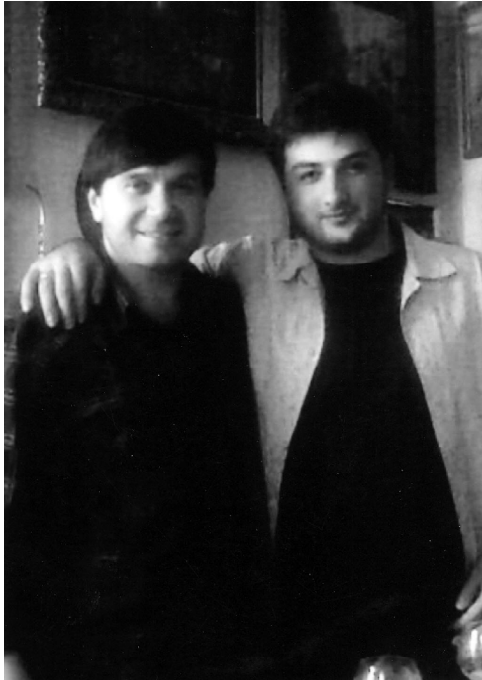
დანი და მსოფლიოში სახელგანთქმული პიანისტი საშა კორსანგია