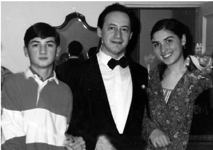
დანი და ჩიორა კამერული ორკესტრის „მოსკოვის ვირტუოზები“ შემქმნელთან და მხატვრულ ხელმძღვანელთან ვლადიმირ სპივაკოვთან