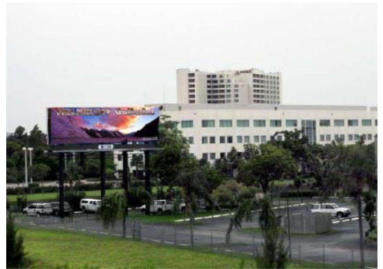
Дорожный биллборд во Флориде с рекламой MELNIKOFF Gallery Network.

мире должна быть оглушительной, как удар грома. Притягательной, как вода в пустыни, и убедительной, как библия. И еще она обязана быть чистой. Как цвета на флаге Грузии - красный и белый. Или, как старое, доброе вино.