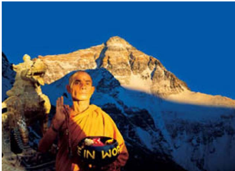
Вид на Эверест от монастыря Ронбук в Тибете. 1998 г. По прямой от фотографа до вершины горы — более 50 км!

Ввязавшись в такую проект и поставив на кон репутацию сразу двух собственных фирм, американцы обязательно найдут еще десяток международных корпораций, которые ухватятся за идею клещами! Это то, что Мельникофф называет перекрестным страхованием.