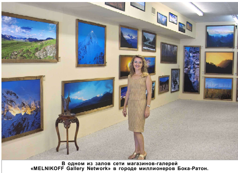
В одном из залов сети магазинов-галерей «MELNIKOFF Gallery Network» в городе миллионеров Бока-Ратон.

Не стоит здесь забывать и о роли красного вина в христианской религии. Консультанты компании считают, что это даст возможность вести крупномасштабную рекламу в СМИ с различной направленностью. Вплоть до религиозных газет и журналов. Которые, кстати, в иных случаях, ни при каких обстоятельствах не будут рекламировать алкогольные напитки. Нужна лишь конкретная торговая марка.