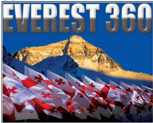
Коллаж с сайта грузинско-американского международного проекта «Эверест-360.info»

Редакция «Свободной Грузии» предлагает вниманию читателей программную статью о современных PR-технологиях. О методах позволяющих делать бизнес на нетрадиционных идеях. С бурным развитием интернет и линий высокоскоростной связи, перед небольшими по численности компаниями, или даже головастыми одиночками, открылось поле деятельности ранее доступное лишь гигантским корпорациям. И как частные космические корабли уже устремили свои острые носы в ближний космос, так и одаренные индивидуумы со все возрастающей скоростью реализовывают национального масштаба проекты, ранее в решении которых могло преуспеть лишь государство.