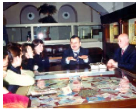
Полосу подготовил Габриел НАМТАЛАШВИЛИ

По словам Романа Гоциридзе, лекции и экскурсии для студентов и учащихся в музее денег станут традиционными. Новое поколение должно ознакомиться с историей денежного обращения в Грузии.