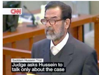
Saddam Hussein Trial Judge asks Hussein to talk only about the case

На заседании 5 апреля Хусейн впервые за время суда был подвергнут перекрестному допросу. Бывший иракский президент признал, что подписывал смертные приговоры шиитам в 1980-х годах. По словам Хусейна, он получал достаточно доказательств того,