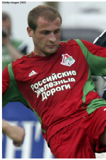
занского «Рубина» - плеймейкер Георгий Кинккладзе и нападаю-

22 марта в Тиране сборная Грузии проведет товарищеский матч с национальной командой Албании. На сбор вызваны 22 футболиста. Главный тренер грузин Клаус Топмеллер не пригласил ведущих игроков сборной Малхазу Асатиани и Шота Арвеладзе. Защитник московского «Локомотива» травмирован, а форвард «Алкмара» занят в клубе, который как раз 22 марта встречается с ПСВ в полуфинале Кубка Нидерландов. Вместо них вызваны два игрока ка-