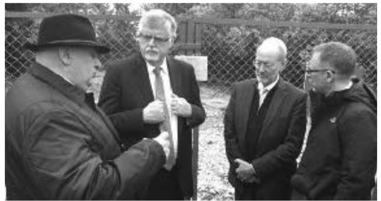
რუსეთის საზღვრებზე სამხრეთ და ჩრდილოეთ კავკასიაში.

დასავლეთში შექმნიდა, რომ თურქეთისა და აზერბაიჯანის შემდეგ, რომლებმაც პირი რუსეთისკენ იბრუნეს, ევროპას კი ზურგი უჩვენეს, მათ, შესაძლოა, საქართველოც დაკარგონ - უკანასკნელი სტრატეგიული ფორპოსტი რეგიონში, შავი ზღვის რეგიონული უსაფრთხოების კონცეფციის ერთადერთი უდავო პარტნიორი, სატრანზიტო ტერიტორია „აბრეშუქის დიდი გზის“ მარშრუტზე, რომელზეც გადის სტრატეგიული მილსადენები და სტრანსპორტო მაგისტრალები, რომლებიც აღმოსავლეთის დასავლეთთან აკავშირებს, ჩრდილოეთს - სამხრეთთან, აზიას - ევროპასთან, „კავკასიის გასაღები“, გასასვლელით კასპის ზღვაზე, ახლო აღმოსავლეთზე და