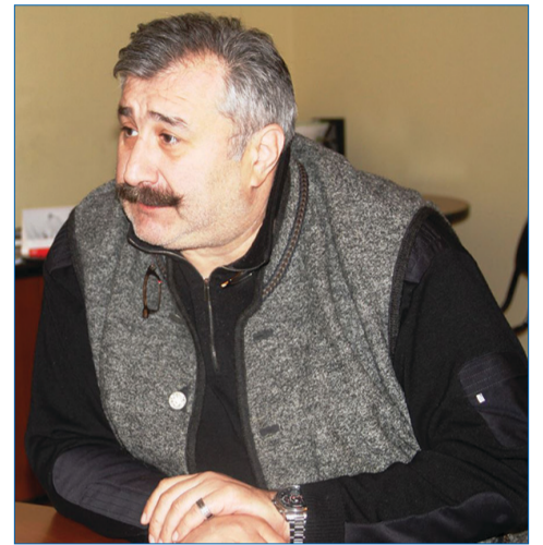
ბულ მოსახლეობას გარკვეული დახმარება გაუწია, გვესაუბრეთ ამის შესახებ.

– როგორც ჩვენთვის ცნობილია, მუნიციპალიტეტის გამგებობამ სტიქიით დაზარალებულ