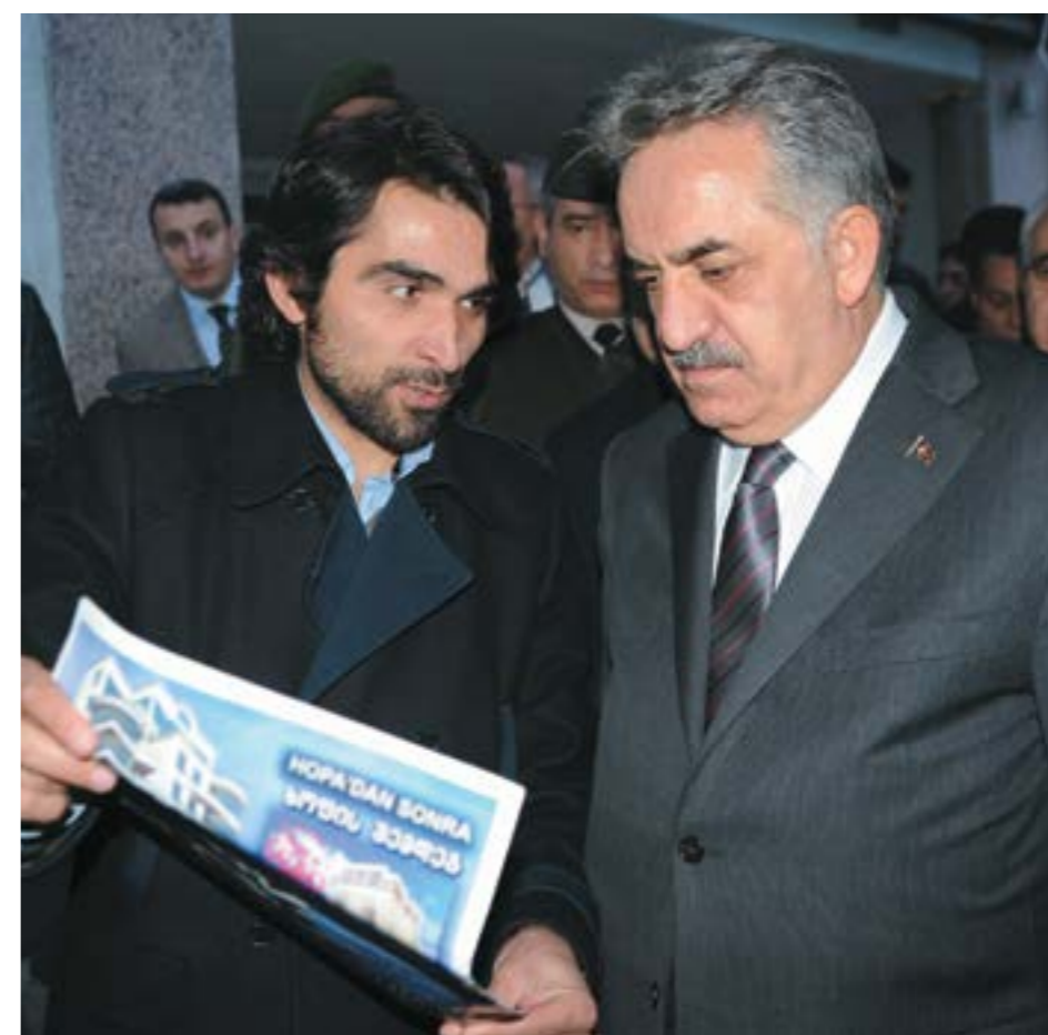
თურქეთის საბაჟოსა და ვაჭრობის მინისტრი ბატონი ჰაიათ იაზივი

ვიზიტის შემდეგ მინისტრმა აღნიშნა: "2011 წლის 12 ივნისს, არჩევნების წინ, რეგიონში გავრცელდა ჭორები იმის შესახებ, რომ გვირაბის მშენებლობის საფუძველი საარჩევნო ინტესტიციად, თვალის ასახვევად იქნა ჩაყრილი და მშენებლობა არც დაწყებულაო. ამის შემდეგ წელიწადნახევარი გავიდა. ახლა, მენარჩევნება და კონტრაქტორებთან ერთად, გვირაბის დიდი ნაწილი მანქანით დაგვათვალისწინეთ. მართლაც საბაჟო პროექტია. საშუაობები სწრაფი ტემპებით გრძელდება. გვირაბი 2014 წლის პირველ მეოთხედში ან პირველ ნახევარში დასრულდება. ამ გვირაბის საშუალებით, ბორჩკა - ხოფას შორის მანძილი 12 კილომეტრამდე შემცირდება და ეს დაახლოებით, 20-22 წუთიანი დროის მოგებაა. ეს