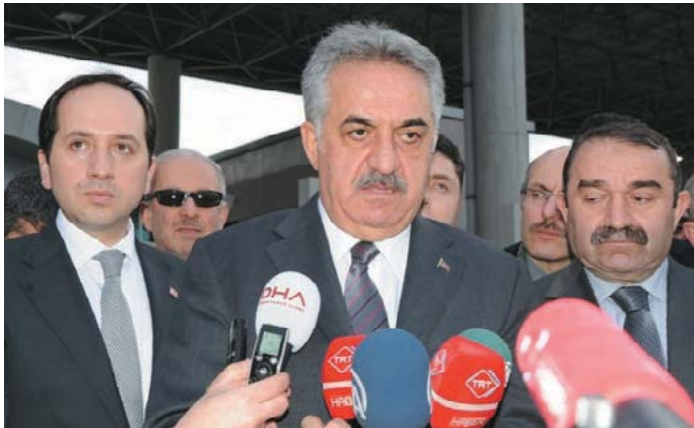
Gümrük ve Ticaret Bakanı Hayati Yazici

Türkiye gümrük ve ticaret bakanı sayın Hayati Yazici "TG Life" gazetesinin Türkiye temsilcisi Mehmet Başarla görüştü. Bakan gazetemizin yönetmenliğine başarılar diledi.