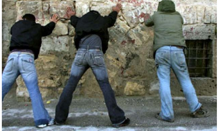
Это не демонстрация новых моделей джинсов; это проверка документов в Хевроне на Западном берегу реки Иордан