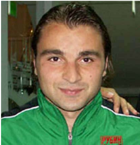
Дэн БЕРНАН, uefa.com

Чемпионат России 2005 года прошел под знаком Москвы: в пятёрке сильнейших финишировали четыре столичные команды. Нарушить эту гегемонию смог лишь казанский «Рубин», занявший четвертое место. Добиться почетного результата в год тысячелетия Казани клубу помог игрок, который громко заявил о себе десять лет назад, но недавно подумывал о завершении карьеры.