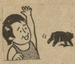
ა. მინაძის ილუსტრაციები. ● ა. თარგამაძის ნახატი.