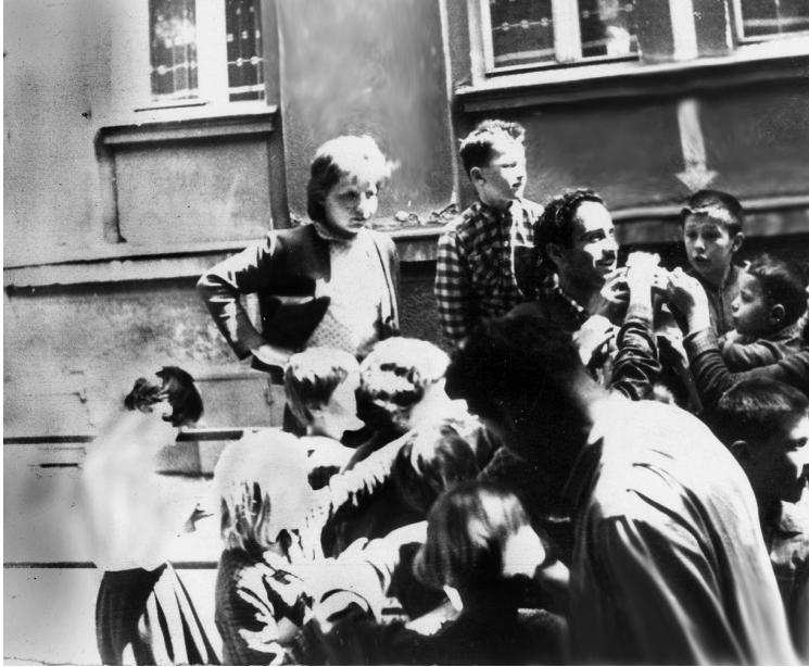
ჩეხოსლოვაკიელ ბავშვებთან ქ. უსტინადლაბემ. 1961 წ.