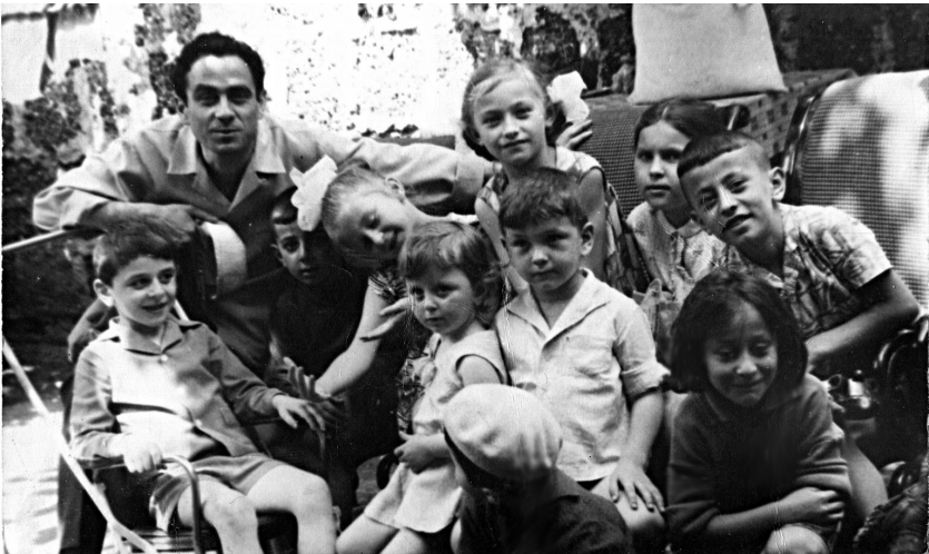
ბათუმელ ბავშვებთან. 1966 წ.