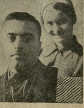
სურათზე: უნივერსიტეტის უნივერსიტეტის სასწავლო კურსების და დაფუძნებული არსებული სტუდენტთა თვითომომხმედ მუშაობის მიერ მხატვრული თვითმომხმედების საღამო, ამავე რიცხვით დღითი თეთვლად სკოლის დარბაზში მოეწყოს აქტიური და ევროპული მასტერი კლასები.