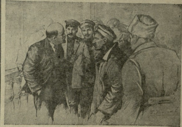
სწავლის: ვ. ი. ლენინი, ა. ბ. სტალინი და დ. მ. კავანოვი რუსეთის სსრკ (8) ფრანკისა და ზუგის სამხრეთი რეგიონების სოციალ-დემოკრატიული რევოლუციის 1917 წლის იანვარში. სტალინი მარჯვნივ ა. ვასილენის (ც. ი. ლენინი) ცენტრალური მუშების

თავის შესანიშნავ აბოლის თეორიებში ლენინმა ბურჟუაზიულ-დემოკრატიული რევოლუციის სოციალისტური რევოლუციად გადასვლისათვის ბრძოლის განხორციელება გეგმა მოგვცა.