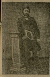
ილია ჭავჭავაძის სურათი

მრავალი პატიოსანი კაცი გულს იხარისხებდა იმდენად, რომ უკვე იმდენად აღმოჩნდებოდა სწავლის განაღდება და სტუდენტობის მნიშვნელობის დაკარგვა, ამიტომაც თავი დაუდევარს სწავლის განაღდებას.