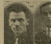
Երեւանի կոմունիստական կուրսի մարտիկները...