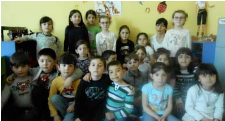
და რომ „დედამინის დღე არის ყოველი დღე“.

გაზაფხული აქტივობებითა და ზეიმებით ყველაზე დატვირთული პერიოდი, მაგალითად, დედის დღისა და აღდგომის ბრწყინვალე დღესასწაულისადმი მიძღვნილი აქტივობები, „ორი რეზო“, „ჭუ-პა-ჭუპა“, ჯგუფიდან ჯგუფში გადასაცემი ღონისძიებები, განმავითარებელი და სპორტული თამაშობები და ბევრი სხვა. ბაღის დირექცია განსაკუთრებულად ემ-