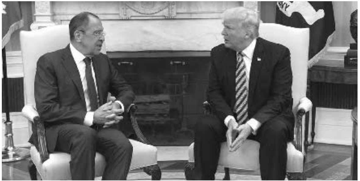
გვიწევსო. საგარეო დარს, რუსეთის მხარე ოპტიმისტურად არის განწყობილი.

რუსეთის საგარეო საქმეთა მინისტრის ვიზიტი სტუმარ-მასპინძლებმა სასარგებლოდ და ნაყოფიერად შეაფასეს. ტრამპთან და ტილერსონთან რუსეთის მხარე რამდენიმე საკითხი განიხილეს. კონკრეტულად რა საკითხები განიხილეს და რაზე შეთანხმდნენ, თავისთავად საიდუმლოდ რჩება, მაგრამ ცნობილი გახდა, რომ შექმნება ერთობლივი სამუშაო ჯგუფი, რომლის ერთ-ერთი მიზანი იქნება, მოამზადონ და განიხილონ დონალდ ტრამპის და რუსეთის პრეზიდენ-