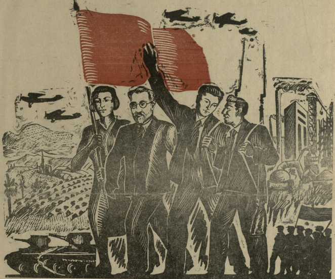
ლაბრი მდინორიბის და ბენიის, ხელოვნების და ლიტერატურის მუშაობა, არგლამის მი-ღინს მუშობა ქალსთან და ვლეობასთან ხელიელ ჩაიდინული და ანბარიობის რუსობისებრი საგროგლარ ბენიორ და კულტურულ კლირიბას:

1819 წელს 1 მასს ღრინს ამხილიც სევერული სევერული რუსობის, სიღარიბის წინ სევერული რეკლამის მიზანობა დასესხების შესახებ, რომ ხაზარბ და განვითარების შემდეგ კლასის რეკლამის მიზანობა