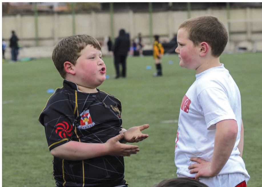
დღის ფოტო. პატარა მორაგბეები.