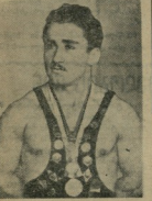
ფაქტის ცენტრ მხარე დაუბრუნა...