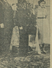
მადრიდის მუსიკის სახელის მქონე მუსიკის ხელისუფლების მხარისგან გამოსვლა