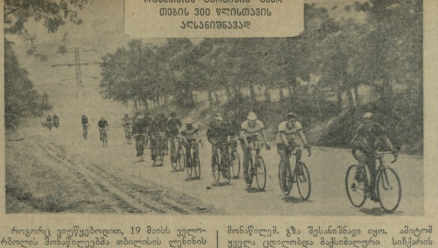
რეკონსტრუქციის, 19 მისი გელო-ბრის მიზანმიმართული მთლიანი...