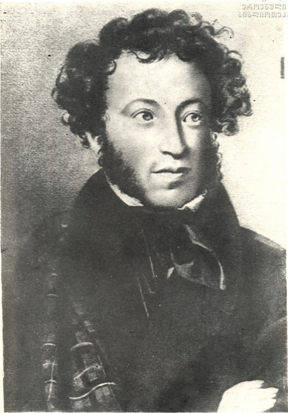
ა. ნ. კუჩუკიძე დაბადებულია 175 წლისთვის ბავშვ